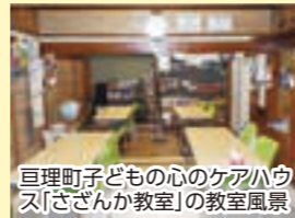
巨理町子どもの心のケアハウス「さざんか教室」の教室風景

心理的・情緒的な問題を抱え、不登校傾向(状態)にある児童生徒に対する心のケアを行う「心サポート機能」、早期学校復帰の支援を行う「適応サポート機能」、児童生徒の学習支援を行う「学びサポート機能」を複合的に行う拠点として、心のケアの専門家や学習支援員などを配置し、町内にケアハウスを設置、運営しています。