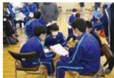
魅力スポットの候補について話し合う生徒たち

12月9日、荒浜中学校で「あらはマップ」作成にあたってのオリエンテーションが開催されました。「あらはマップ」は、東日本大震災の教訓を後世に伝えるとともに、被災地である荒浜地区の復興した姿と魅力を全世界に発信することを目的に、NPO法人海族DMCと荒浜中学校が合同で作成する荒浜地区の防災マップの機能を備えた観光スポットマップです。 オリエンテーションでは、生徒たちによる荒浜地区の魅力スポットについての話し合いが行われ、生徒は「震災を体験した自分たちだからこそ発信できるマップを作成し、世界に発信したい。」と意気込みを話しました。 「あらはマップ」は、今後生徒たち自身が魅力スポットの取材を行うなどして作成を進め、令和3年3月11日に荒浜中学校で開催される防災集会に合わせて披露する予定です。