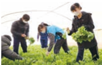
春菊を丁寧に収穫する生徒たち

12月16日、仙台大学附属明成高等学校の生徒5人が、逢隈今泉地区の春菊農家を訪れ、春菊の収穫に挑戦しました。これは、県内一の生産量をほこり、亶理町の特産である春菊の特性を栽培を通じて学ぶとともに、春菊が苦手な人でも食べられるレシピを高校生に考案してもらい、もっと多くの人に春菊を味わってほしいとの思いから、全農みやぎとJAみやぎ亶理逢隈支所野菜部会が共同し取り組んでいる「春菊プロジェクト」の一環で実施したものです。 当日は、生徒たちが10月16日に定植した春菊を丁寧に収穫し、細かな出荷規格を確認しながらの袋詰め作業を体験しました。収穫を体験した生徒は、「初めて春菊を定植から収穫まで経験することができた。栽培を通じて学んだ特性をレシピづくりに活かしたい。」と話しました。