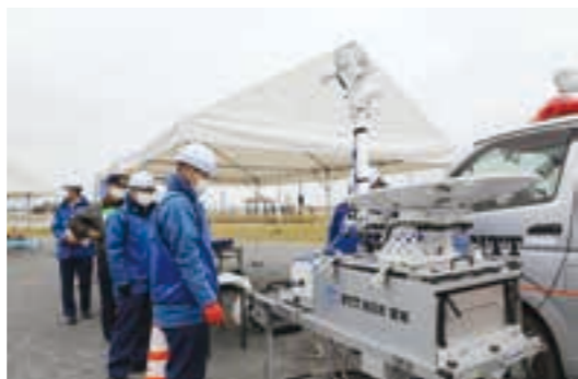
移動基地局による通信確保訓練の様子

旬を迎えた県内1の収穫量を誇る巨理町の春菊。春菊は手で折ることで簡単に収穫ができ、1回の種まきでおよそ4回も収穫が出来るそうです。鍋で食べるもよし、サラダで食べるもよし、アイスやそばにも使用されている美味しい春菊をみなさんも味わってみてはいかがでしょうか。