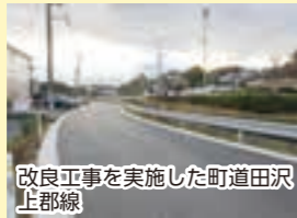
改良工事を実施した町道田沢上郡線

幹線町道などを重点的に整備するとともに、生活道路の環境改善を推進するため、老朽化した舗装路面の更新整備や側溝の改良工事などを行います。また、国からの交付金を活用して、通学路の歩道整備や橋梁の点検・修繕などを実施しています。