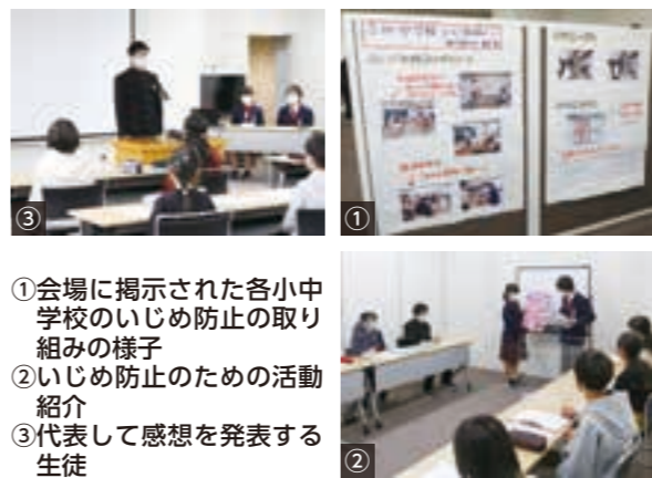
①会場に掲示された各小中学校のいじめ防止の取り組みの様子 ②いじめ防止のための活動紹介 ③代表して感想を発表する生徒

当日は、各校の代表児童生徒が、いじめのない学校や学級とするために取り組んでいる仲間づくりや居場所づくりの活動をポスターや写真などを使い紹介したほか、意見交換を