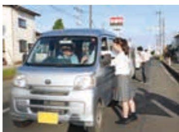
交通安全を呼びかけながら苗木を手渡す生徒たち

参加した生徒は、「今回渡した苗木を自宅に飾って、苗木を見たときに交通安全への気持ちを思い出してほしい。」と話しました。