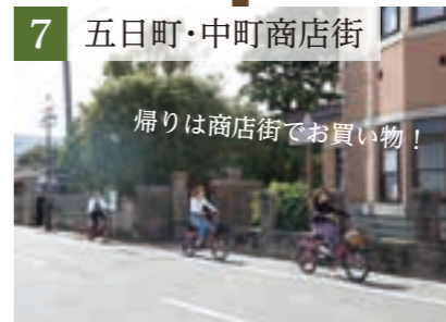
7 五日町・中町商店街