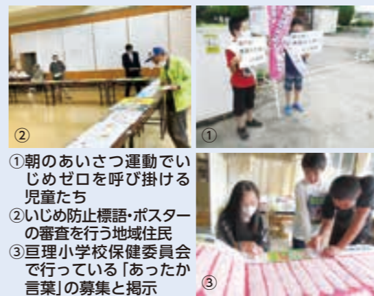
①朝のあいさつ運動でいじめゼロを呼び掛ける児童たち ②いじめ防止標語・ポスターの審査を行う地域住民 ③巨理小学校保健委員会で「あったか言葉」の募集と掲示

これを受けて各学校では6月の強化月間で、「いじめゼロの呼び掛け」や、「いじめ防止標語づくり」、「ポスターづくり」などの、新たな活動にも取り組んでいます。これらの活動は、児童生徒の