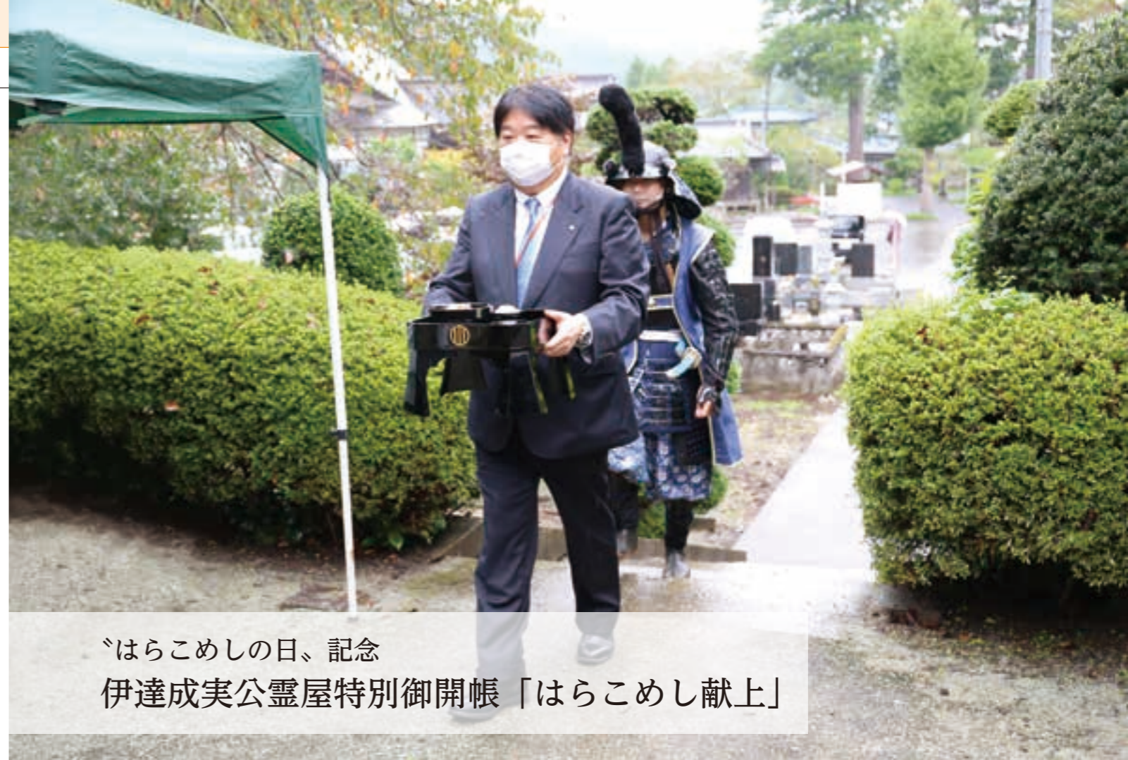
「はらこめしの日、記念 伊達成実公霊屋特別御開帳「はらこめし献上」