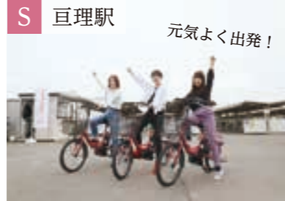
S 巨理駅 元気よく出発!