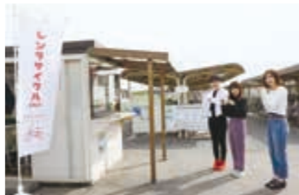
▲受付は大きなのぼりが目印!