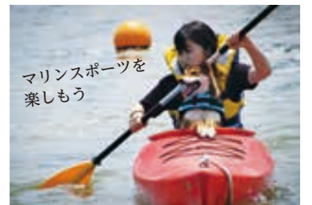
マリンスポーツを 楽しもう

わたりの魅力をもっと堪能したい方へ groovy girlsの 荒浜オススメspot!