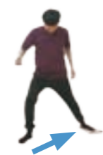
②タオルを踏んだ方の足をいろいろな方向に大きく動かす。