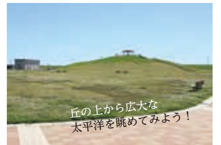
丘の上から広大な 太平洋を眺めてみよう!