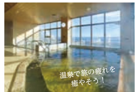
温泉で旅の疲れを 癒やそう!