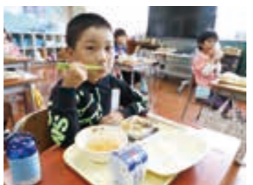
美味しく召し上がっている児童たち

これは、新型コロナウイルスの影響で外食需要やインバウンドの減少により、消費の落ち込みや価格の下落といった影響がでている県産牛肉の消費拡大を図るため、県の県産牛肉学校給食提供支援事業補助金を活用し実施されたもので、9月25日の給食では、仙台牛を使用した牛丼が提供され、児童たちは、普段は提供されることのないスペシャル給食を美味しく味わっていました。また「スペシャル牛丼は、とても美味しかったです。また食べたい。」と話しました。学校給食センターでは、更なる消費拡大を図るため、11月にも仙台牛を使った給食の提供を予定しています。