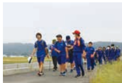
津波避難道路「五十刈線」を歩く生徒たち

参加した生徒は、「みんなで声を掛け合いながらゴールすることができた。これからの学校生活もみんなと協力しながら過ごしていきたい。」と話しました。