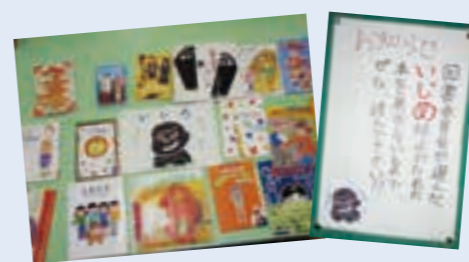
いじめ防止に係る本の紹介

学級活動や道徳の授業での話し合い、「いじめ防止に係る本の紹介」、「いじめ防止ポスター」の掲示など、児童生徒自身が主体的にいじめの問題について考えることが出来る環境や時間を設ける取り組みもその一つです。