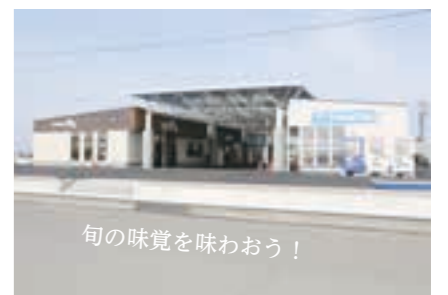
旬の味覚を味わおう!