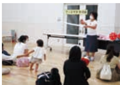
大好評だったバルーンアートの披露

今回開催された交流会は、ファミリー・サポート・センターの活動を多くの人に知ってもらうとともに、会員と一般参加者の交流を図るために開催されたもので、当日は会員によって大型絵本の読み聞かせや手遊び、バルーンアートなどが行われました。また、会員が持ち寄ったおさがり品が無料提供され、参加者からは、「子ども服はすぐに小さくなるので、とても助かる。」と喜びの声が聞かれました。