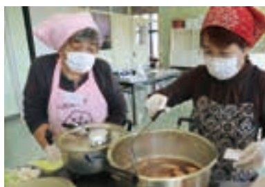
アドバイスを受けながら調理する参加者

参加者は、「久しぶりにみんなと楽しくはらこめしを作ることが出来てとてもよかったです。」と笑顔で話しました。