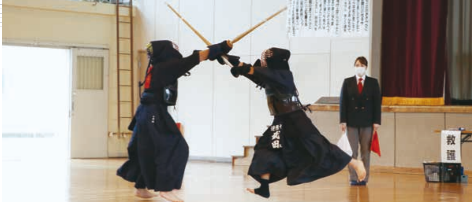
令和2年度亶理郡中学校新人大会が、亶理郡内の各会場を舞台に9月26日、27日の両日に開かれ、各競技で熱戦が繰り広げられました。今大会は新型コロナウイルス感染症の影響により、各競技で換気や、消毒の徹底など感染症の予防策を講じたうえでの開催となりました。