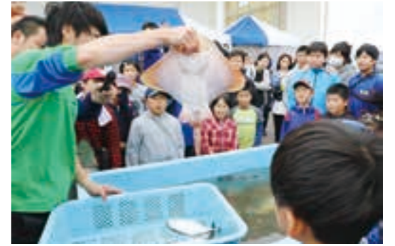
荒浜港で獲れた地魚について学ぶ子どもたち

7月7日、「浜っ子と海のふれあい会」が鳥の海 のシーサイドベースで開催され、荒浜地区の中小学 生や、その保護者など約120人が参加し、会場は 大きな盛り上がりを見せました。 これは、子どもたちに荒浜の海の素晴らしさを体 験とおして感じてもらうことで、地元の海を誇り に思う気持ちを育てることなどを目的に、地域住民 を主体とする荒浜地区まちづくり協議会が主催し、 荒浜小学校保護者、地元の漁業関係者などで構成 される浜っ子と海のふれあい会実行委員会が開催し たもので、当日は、地魚勉強会や浜っ子クッキング のほかミニセリ体験が行われました。 地魚勉強会では、仙台うみの杜水族館から招かれ た講師が、水槽に入ったヒラメやカレイなど荒浜の 海で獲れた魚の生態について説明すると、説明を受