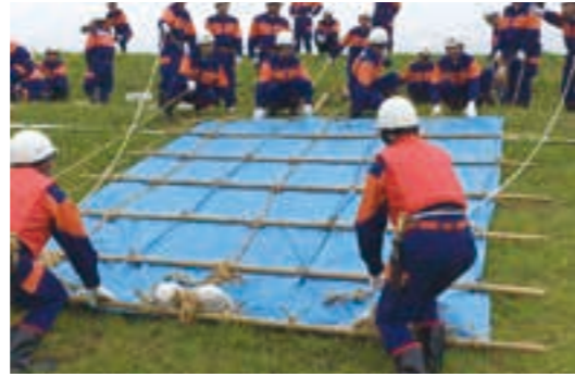
救命胴衣を着用しシート張り工法に取り組む団員 たち

今月の表紙 クリテリウム巨理・鳥の海 大会での一コマ。選手同士の コーナーでの駆け引きと スリリングなレース展開に 観客からも熱いエールが送 られました。