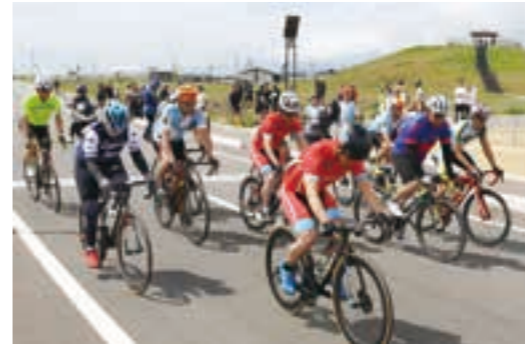
鳥の海公園特設コースを駆け抜ける参加者たち

6月23日に鳥の海公園の外周約1・6kmの特設 コースを周回する自転車競技「クリテリウム巨理・ 鳥の海大会」が町と宮城県自転車競技連盟との共催 で初開催されました。 これは、仙南地域での自転車競技大会およびイベ ントの開催がないことや、多くの人に自転車競技へ の興味・関心を持ってもらい、環境に優しい自転車 の普及を推進することを目的に開催されたもので、 大会では、キッズの部からチャンピオンの部まで11 種目が設定され、県内外から集まった約1200人の 選手が潮風を感じながら1周×22週の周回レースに 挑みました。