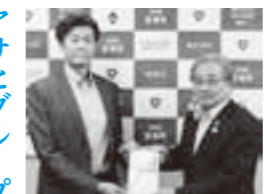
上野株式会社から長寿社会対策基金寄付

亘理町にあるソーイングロックを運営している上野株式会社から、長寿社会対策基金として10万円が寄付されました。