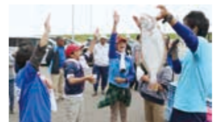
ミニセリ体験で盛り上がる子どもたち