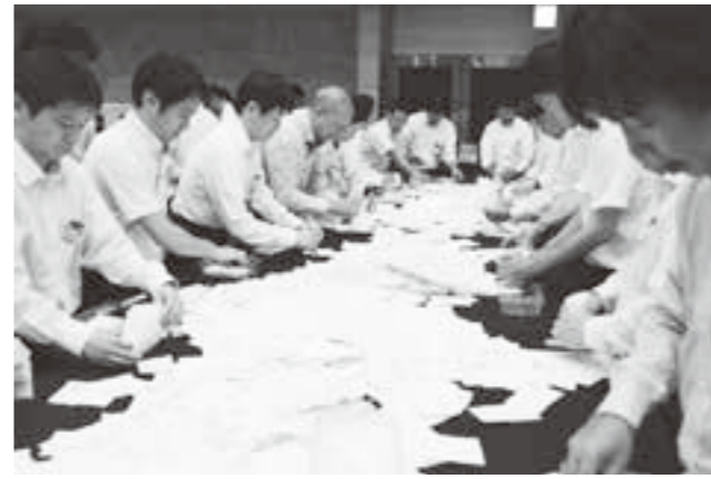
巨理町選挙管理委員会 341111

7月21日、第25回参議院議員通常選挙の投票が、町内15カ所の投票所で行われました。 当日の巨理町の有権者数は28,561人で、14,121人の方が投票し、投票率は宮城県選挙区選出議員選挙で49.44%を記録しました。前回平成28年(52.29%)と比較すると2.85ポイント減少しました。