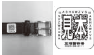
シールはベルトや靴、ハンカチなど、普段に身につけるものに貼り付けます。