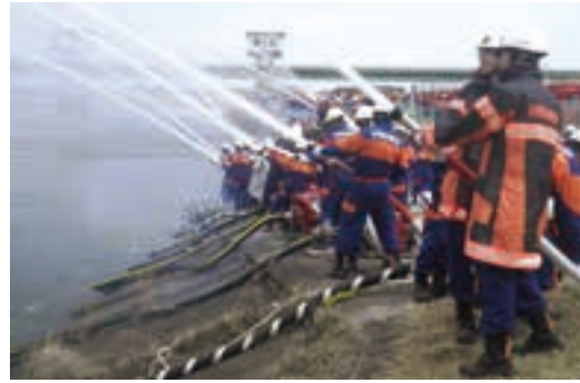
本番さながらに全分団で行う実地放水訓練

今月の表紙 荒浜小学校での一コマ。6年生が真剣な表情で習字の授業に取り組んでいます。「令和」時代に子どもたちの笑顔が溢れますように。