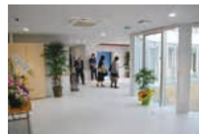
広々とした所内を見学する参加者