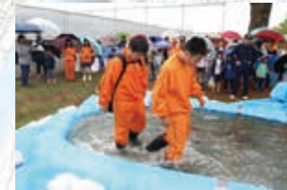
強水流歩行体験の様子(昨年度)