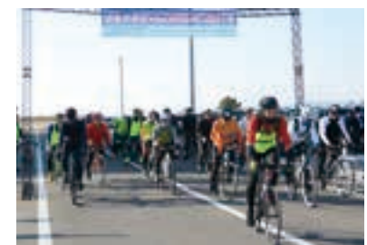
シーズン開幕のスタートを切る参加者

3月17日、サイクルイベント「よもやまチャレンジライド2019」が、わたりシーサイドベースを発着点として、角田市、丸森町、山元町を巡る約80kmのコースで行われました。 宮城のサイクルシーブズのスタートをつける大会として初開催され、遠くは神奈川県から参加するなど県内外の約200人のサイクリストが早春の県南を楽しみました。 また、コースの途中には、各市町のグルメが楽しめるエイドステーションが設けられ、ほっきめしやずんだ餅などの特産品が振舞われるなど、旬の味覚に舌鼓を打ちながら交流を深めるサイクリストたちの姿が見られました。参加者は「エイドが充実した内容で、美味しく楽しく走れた。」と話していました。