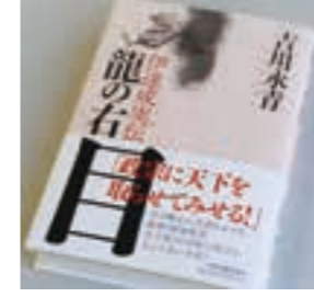
PHOTO (写真上) 成実公の木像に手を合わせるわたりん (写真下) 伊達成実公の波乱に満ちた生涯を描いた傑作「龍の右目 伊達成実伝」

また、昨年11月に伊達成実公の生涯を描いた歴史小説「龍の右目 伊達成実伝 吉川永青著/角川春樹事務所」が出版されました。「決して後退しない、前進あるのみ」と言われる毛虫を兜の前立にして、伊達成実の勇猛さを誇り、伊達成実の一人とも数えられた亘理伊達成実の初代当主伊達成実。本書は、伊達成実の片腕として支え続けたその波乱に満ちた生涯を描いた傑作です。図書館でも好評貸出中ですので、みなさんも伊達成実公生誕450年の今年、亘理要害の建設や城下の整備、さらに治水、用水、新田開発など、亘理の発展に尽力し、今日の亘理の原形を築いた成実について知りたくしてみませんか。