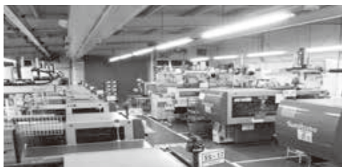
精密機器部品のプラスチック成形を手がける工場内部

株式会社北上エレメック 袖ヶ沢工場 住所：巨理町達隈神宮寺字袖ヶ沢45-7 電話：23-1991