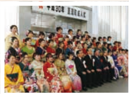
式終了後には各中学校の卒業生で記念撮影が行われました