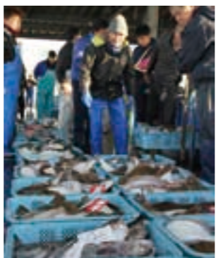
新鮮な魚が競り落とされた初競り

1月5日に荒浜漁港で初競りが行われ、今年初めて水揚げされた約2・5トンの魚が競りに掛けられました。 鮮魚の荷さばき場では、荒浜の特産であるカレイやヒラメをはじめ、赤貝やワタリガニ、これから旬を迎えるタラなどが、威勢のいい掛け声とともに次々と競り落とされていきました。