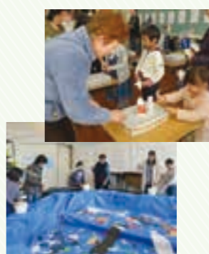
第2回オープンスクールデーの様子

学校見学で小さな学校ならではのアットホームな雰囲気を感じてみてください。どなたでも参加可能です。多くの方の来校をお待ちしています。