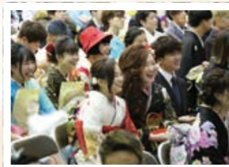
スクリーンに映し出された中学生時代の写真に新成人たちは笑顔を見せました