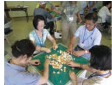
☎ 地域包括支援センター (☎34-1331)

～飲まない・吸わない・賭けない 大人のたしなみ～ みなさんは「麻雀」と聞いてどんなイメージを持ちますか? 健康麻雀愛好会では、「飲まない・吸わない・賭けない」合言葉のもと、60歳以上の麻雀愛好者が性別を問わず麻雀を楽しんでいます。吉田農村創作活動センターを会場に月2回行われる例会のほか、年に6回開催される大会など、日頃の成果を発揮する機会もあり、毎回大きな盛り上がりを見せています。また、吉田西部地区の方だけでなく、各地区から参加するメンバーや、夫婦での参加も多くなっています。頭の健康体操でもある「麻雀」。今年度は、逢隈公民館や荒浜公民館でも健康麻雀の事業を展開するなど、町内でも活動が広がっています。初めての方も経験者の方も興味のある方は一度見学してみたいでしょうか?