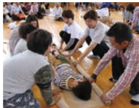
動けない傷病者をタオルで運ぶ応急手当訓練の様子

今月の表紙 吉田小学校で実施された巨理町総合防災訓練の一コマ。子どもたちは、消防隊員に丁寧に教えられながら、初めて触る消火器を握り締めて消火訓練に臨みました。