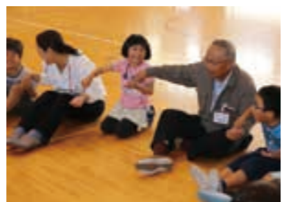
開校式後のレクリエーションの様子

地域の方々から講師を務める「放課後楽校inわたり」が、6月5日に開校しました。 この事業は、放課後に安心安全な子ども居場所を確保するとともに、地域の方々の参画を得て学校の授業にはない様々なプログラムを行うものです。異学年の子どもたちや地域の大人の方々の交流の機会を増やすことを目的に、町内の小学校では3校目の開校となります。 巨理小学校で行われた開校式では、参加を申し込んだ児童30人と、巨理地区在住のボランティアスタッフ13人が顔を合わせ、「ルールを守る」「お互いに教え合う」などの5つの約束を確認しました。