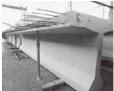
高品質の製品で 地域社会に貢献