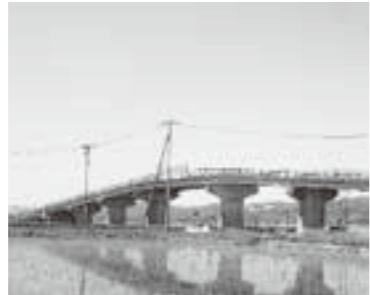
当社製造・施工の ストロベリーブリッジ、 (巨理町南新田地内)