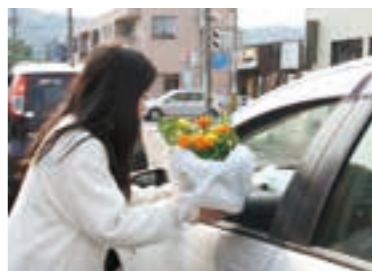
花苗を手渡し交通安全を呼びかける生徒

交通安全を呼びかけながら花苗を手渡し巨理高校の伝統行事「フラワー作戦」が5月30日に行われました。 これは、普通科園芸コースがある巨理高校の生徒が、実習で育てた花苗をドライバークラスや通行人に手渡しながら交通事故防止を呼びかけるもので、30年ほど前から毎年春と秋に行っています。 当日は、交通安全委員会と奉仕委員会の生徒ら約60人が主要地方道塩釜巨理線の沿道に立ち、ドライバークラスや通行人に「安全運転と飲酒運転根絶に協力お願いします。」と声をかけながら、色鮮やかなマリーゴールドの花苗を手渡しました。 参加した生徒は「みんな笑顔で受け取ってくれて嬉しかった。きれいな花を見て少しでも交通安全に努めてほしい。」と話していました。