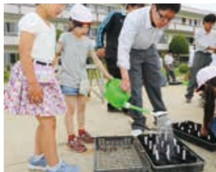
種を植えたプランターに高校生と一緒に水をやる小学生