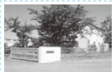
東日本コンクリート株式会社

これからも、地域社会全体の思いをしっかりと受け止め、社員一人ひとりがさらなる技術力を発展させ、高品質なPC製品を製造し地域社会に貢献していきます。