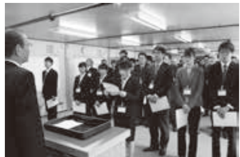
職務を宣誓する新規採用職員