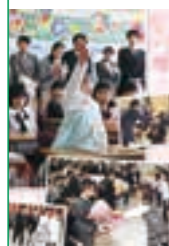
今月の表紙 小学校入学式の一場面。期待と不安が混じった表情を浮かべる新入生のみなさんを、周りの大人たちが温かく見守っています。