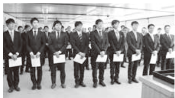
新年度から着任した派遣職員のみなさん