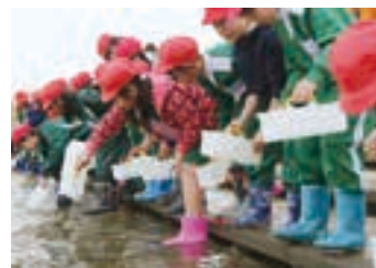
Photo (写真上) ふ化場の水槽に餌をまく児童たち (写真下) 声をかけながら阿武隈川に稚魚を放流