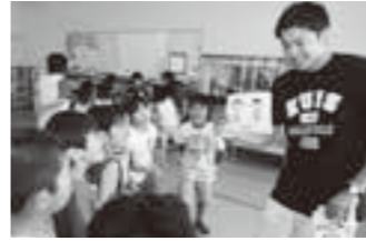
PHOTO (写真下) イラストを見せながら英単語を教える学生