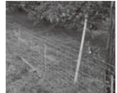
シシストップの施工例