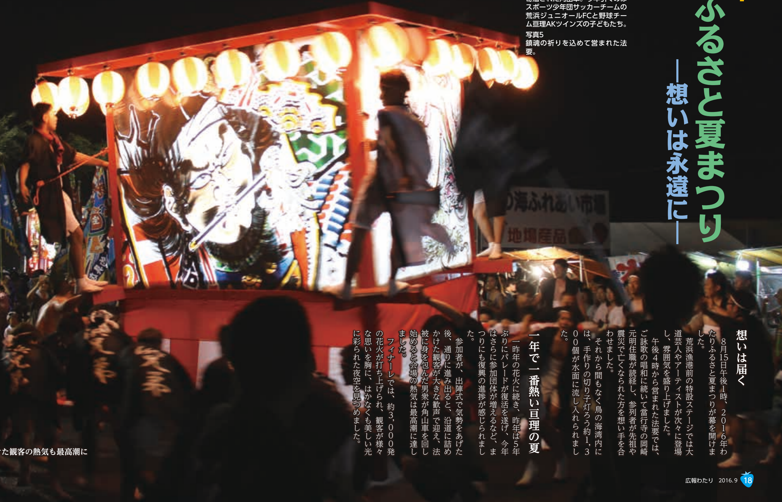
角山車が回り出すと沿道に詰めかけた観客の熱気も最高潮に