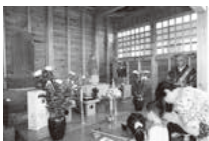
完成したお堂で地蔵に手を合わせる住民