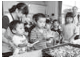
【野菜のチーズ焼き】を待つ子どもたち

野菜が育ち調理されて食卓に並ぶことを知った子どもたち。一緒に育ててくれた方や調理してくれた方に、感謝の気持ちを込めてしっかりと「いただきます」や「ごちそうさま」のあいさつをしていました。