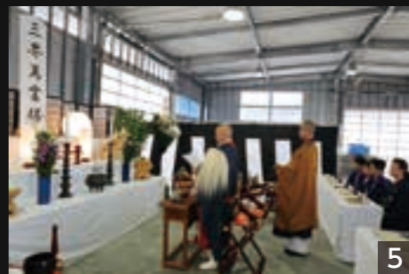
写真4 北海道伊達市の有志団体から昨年寄贈された角山車。今年引くのはスポーツ少年団サッカーチームの荒浜ジュニオールFCと野球チーム巨理AKツインズの子どもたち。 写真5 鎮魂の祈りを込めて営まれた法要。