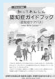
認知症に関する事柄を網羅した一冊

冊子には、認知症の基礎知識はもちろん、どのようなサービスを利用できるかなどの実用的な情報を掲載しました。ぜひ一読ください。