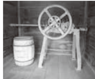
創業当時の製釘機