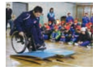
PHOTO (写真上) 車いすに乗りシュート体験する児童 (写真下) パリアフリーの大切さを実演で検証