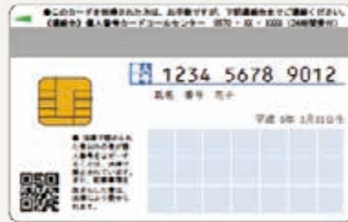
（裏面）マイナンバーを記載し、電子申請用のICチップが搭載されます