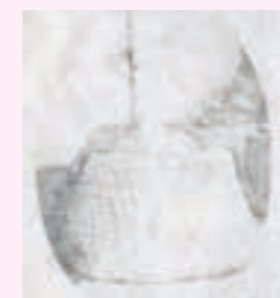
▲エズコの中の赤ん坊-島田家アルバムより・年代不詳-

わたりの民俗 53 エズコの中の赤ん坊 戦後間もない頃まで、赤ん坊は生まれて間もなくからエズコの中で育ちました。朝、親たちが野良に出ると昼に戻るまで、赤ん坊はエズコに入られ家に置かれました。母は、屋に田畑から上がって来ると授乳しながらご飯を食べ、鍋釜を洗って再び田畑に出て夕方まで戻りません。このように授乳間隔が長く回数も少ないので赤ん坊は十分に栄養が取れず、休まない労働で疲労した母体ではお乳が十分にできません。また、長時間おしめを取り換えないために、赤ん坊のお尻はすぐぐにたれました。 そのような時代、保健婦たちは育児指導のため定期的に家庭訪問をしました。家人のいない家の戸口を入ると、人の気配を察してエズコの中で赤ん坊が泣き出します。抱き上げおしめを替え、ただれたお尻に赤チン(マーキョロ)を塗って手当をしました。赤チンを塗るのは、保健婦が訪問したことを親たちに知らせる意味もありました。 当時のおしめは、オコシ(腰巻)・丹前下・浴衣・布団皮の古い物をたおして(ほどいて)刺し子のように縫ったものでした。汚れたおしめは、田んぼの用水路や堀で洗って土手の草の上などに干しましたが、乾くとゴワゴワしてかたく、おむつかぶれの原因にもなりました。そこで保健婦は、おしめを手でもんで柔らかくしてからお尻に当てました。ひととおり赤ん坊の世話を終えて帰ろうとする時、今度はおっぱいをせがんで泣くのです。そういう時は、「後ろ髪を引かれる思いで泣く泣く帰ってきた」そうです。現在とは育児環境が全く異なる時代ではありましたが、赤ん坊たちはたくましく成長していきました。 ※エズコ・嬰兒籠の訛り、イツコ、エンツコなどとも言つ。