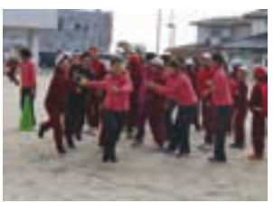
PHOTO (写真上) 選手と校庭内をジョギングする児童たち (写真下) トラックを1人2周するリレーに挑戦