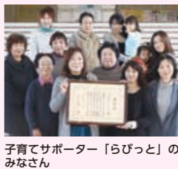
子育てサポーター「らびっと」のみなさん

「らびっと」は、子育てサロン「ピープル・ツリー」を開催しているほか、第二反抗期を迎える三歳児の保護者を対象とした「三歳児の世界学習講座」などの講座運営に積極的に関わり、地域や家庭の教育力向上に貢献してきました。これらの活動の中で、今回の表彰では、思春期保健体験事業「明日の親となる中学生を対象とした子育て理解講座」が、優れた学校支援活動として評価されました。