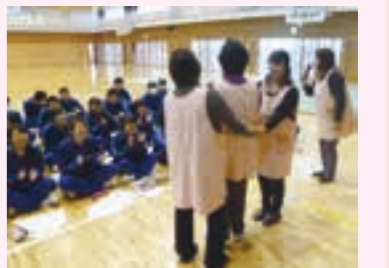
中学生に子どもあそびを実演してみせるサポーター

講座は全3回で構成され、最初に幼児が好む遊びや読み聞かせの方法を紹介し、一緒に実践します。生徒が実体験することで、幼児と関わることに對する不安を解消できるように工夫しています。それでも生徒は、緊張しながら子どもたちと対面し、活動が進むにつれて笑顔が増え、互いに生き生きとふれあう光景が広がります。