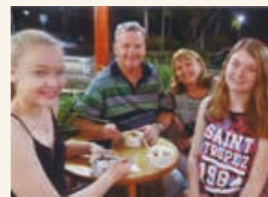
▲愛情あふれるホストファミリーのみなさん

短期間のホームステイでしたが、ホストファミリーの愛情を受け、あらためて家族の大切さを実感しました。