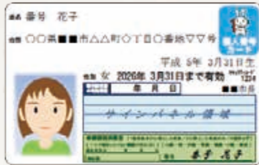
（表面）氏名、住所、生年月日、性別のほか本人の顔写真が記載されます