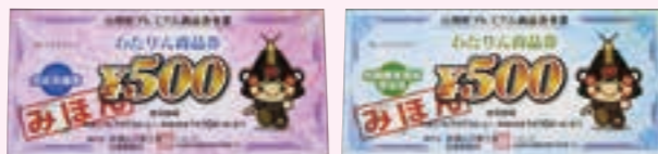
わたりん商品券(見本)

使用期限を過ぎた場合は無効になりますので、 使い忘れのないよう、もう一度確認をお願いします。