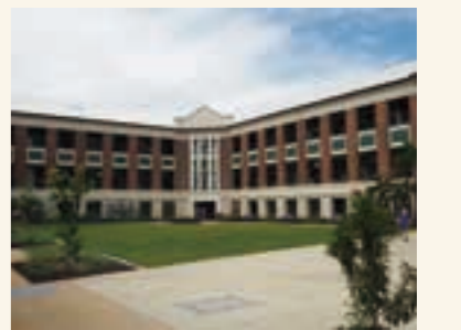
▲3日間体験入学したケアンズ・ステイト・ハイスクール

コミュニケーションは、言葉だけではなく、相手を思いやり、理解する気持ちが大切だと学びました。