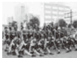
(写真上)「街道を歩く会」で町内を歩く生徒たち (写真下)「みちのくYOSAKOIまつり」で「荒中えんころ」を披露