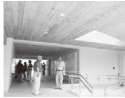
広い入口部分が特徴の大谷地住宅

東日本大震災の被災者向けに巨理町が整備を進めてきた災害公営住宅のうち、最後に完成した大谷地住宅で7月20日・21日に内覧会が開かれ、入居予定者が新居を確認しました。 大谷地住宅は、総戸数30戸の一棟で、開口部が広い1階中央部分のエントランスホールには、車いす用のスロープが設置され、天窓から明るい日差しが差し込みます。 浜吉田駅近くに立地し、東側には昨年中に引き渡された、戸建ての災害公営住宅と防災集団移転で再建を果たした皆さんが生活しています。 内覧会初日は、計14世帯が町の担当者や施工業者から設備の説明を受けたほか、入居者の身に危険が迫った際には、ベランダにある隣家との壁を破って