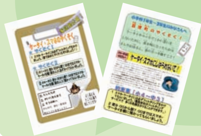
家庭用のポスター(左)と児童生徒向けのチラシ(右)