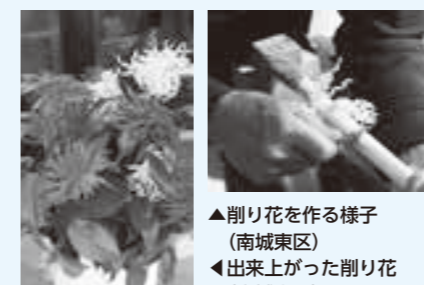
▲削り花を作る様子(南城東区) ▼出来上がった削り花(南城東区)

彼岸は春と秋と、1年に2回訪れます。それぞれ春分と秋分を中日とし、前後3日間をあわせた7日間が、春彼岸、秋彼岸とされます。春の彼岸には草餅を、秋の彼岸にはおはぎを供えるといった風習が広くみられますが、特に春には色鮮やかな削り花が墓前を飾り、春の彼岸独特の供え物と言えるでしょう。