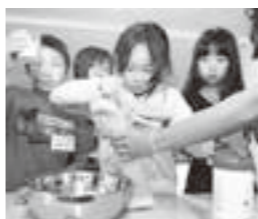
Photo (写真上)最後にリレー形式でロープワークの習熟度をチェック (写真下)炊き出し訓練でコメと水を袋に入れる児童