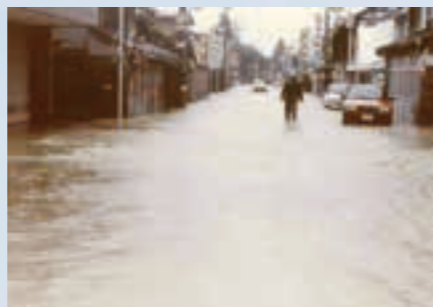
台風10号の被害 (中町商店街)