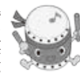
荒浜小学校のキャラクター「あらドン」

「荒浜を明るくしたい。」震災後、宮城県で一番早く自分たちの学校に戻ってきた、平成25年4月の子どもたちの願いでした。3階の教室から荒浜を見渡ししながら、計画委員会の子どもたちが考えた活動が「花いっぱい運動」です。マナーアップキャンペーンの一つとして、縦割り班で協力しプランターに植えた花を、荒浜に戻り住んでいる方や、荒浜で働いている方々のもとへ配りました。