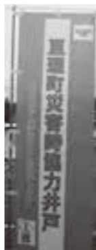
提供の意思を表すのぼり旗

この制度は、井戸所有者の協力のもと成り立つものです。災害による水道の断水時に、のぼり旗が掲示してある井戸から井戸水を提供していただきます。利用する場合は、夜間・早朝の利用や大量の取得を避けるなど、マナーを守るとともに一部飲料に適さないものもありますので、確認のうえ利用してください。また、災害の状況によっては井戸が使用できない場合もありますのでご理解願います。