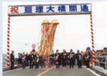
巨理大橋完成開通式 (昭和56年6月20日)