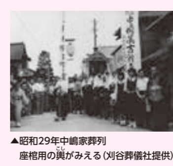
▲昭和29年中嶋家葬列 座棺用の輿がみえる

死者を送る 親しい人との永遠の別れは、予測しがたく辛いものですが、あの世へ旅立つ死者を送る葬送のあり方は、時代によりずいぶん変化してきました。 現在は、葬儀一切が葬祭会館で行われるようになりましたが、以前は、家で葬儀が行われ、葬列を組んで死者を送り出しました。このような野辺送りの葬列が通る近隣の家々は、軒先に小さな机を立てて香炉を置き線香を立てて手を合わせ、隣人との別れを惜しみました。葬列の最後には、「まき菓子」といってお菓子が配られるので、子どもたちはこぞつて行列を追いしました。 町内では、昭和26年に火葬場が整備されたことで、火葬が浸透しお棺の形も変わりました。火葬以前の土葬時代は、死者を座位で入棺する座棺でしたが、火葬場の火葬炉が寝棺用であったことから、現在のような寝棺に変化したようです。