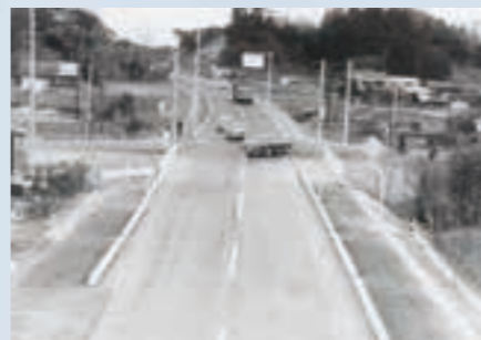
開通当時の巨理バイパス (祝田交差点)