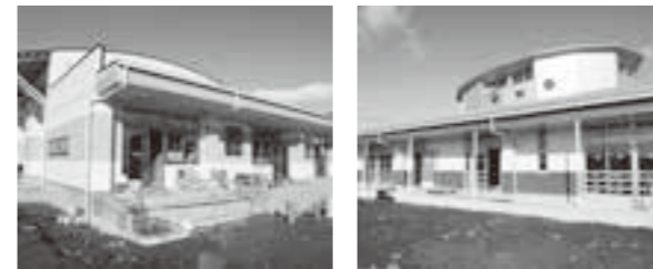
建設中の荒浜保育所（左）と吉田保育所