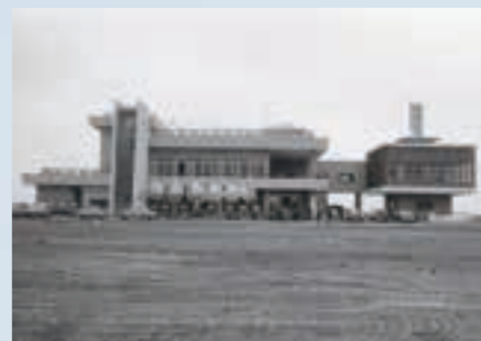
国民保養センター落成 (昭和44年7月16日)

記念セレモニーを開催します 日時 2月1日(日) 午前8時50分 場所 中央公民館大ホール 当日は60年の歩みを振り返るスライド上映を行います。 ぜひお越しください。