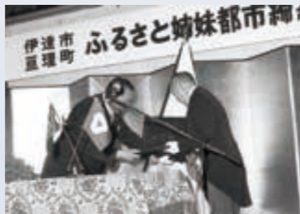
北海道伊達市と姉妹都市締結 (昭和56年4月17日)