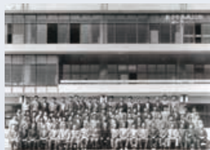
役場新庁舎落成 (昭和38年4月21日)