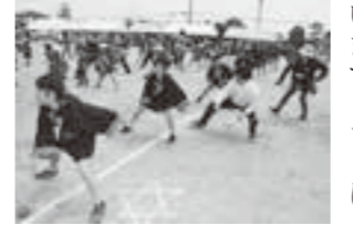
(写真上) マナーアップキャンペーンの「花いっぱい運動」の様子 (写真下) 「全校大漁節踊り」をしている児童と保護者・地域の方々

荒浜小では、たがいに信頼し合える集団作りを促すため、「縦割り班遠足」の実施や、阿武隈川の繋がりを大切にした「福島県川谷小学校との交流会」を、地元の方と保護者の方の協力のもと実施しています。また、全職員がスクールカウンセラーを交え、アドバイスをもらいながら、子どもたちについて語り合う「子どもを語る会」を定期的に開き、心のケアも大切にしています。