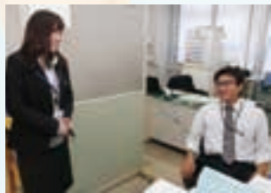
「何でも任せられますよ。」同僚の信頼は厚い

しかし、三桜高校在学中に急に迷いが生じます。「本当にやりたい事はこれなんだろうか。」医療系の進路を希望する同級生を見ながら、人を助ける仕事は、看護師以外にもあると考えるようになりました。「みんなのために仕事がしたい。」