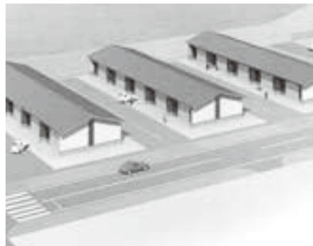
漁具倉庫の完成予想図

の消防団活動を陰で支えた妻の功績に対する妻賞が贈られました。 また、出初式に先立ち消防団機械器具点検式が校舎北側で行われ、指揮者の号令に従い、各班の機械担当者が車両および装備品の点検を行いました。 その後、小型ポンプ積載車31台、消防ポンプ自動車4台全てのエンジンを順番に始動させ、今年1年の緊急出動に備えました。 担当/総務課 安全対策班 ☎(34)1111