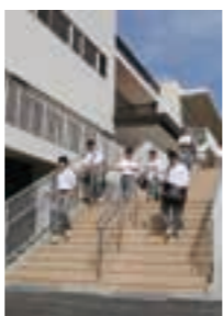
2階の出入口から階段を降りて下校する生徒たち

その屋根には太陽光パネルが設置され、バッテリーに充電される仕組みで、非常時には夜間照明で3日分の電力を供給します。