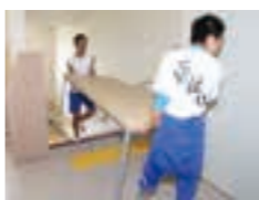
作業台を運び込む長瀬小の卒業生

引越し作業 地域と連携 完成した長瀬小学校新校舎への引越しが7月27日に行われ、地域の方々や小学校の卒業生約100人が参加しました。当日は、間借りしていた吉田中学校から机や椅子を運搬用のトラックに積み込む班と、長瀬小学校の体育館に収納していた工作用の作業台などの備品を新校舎に運び込む班の2班に分かれ、午前9時に2カ所同時に作業が開始されました。長瀬小学校での作業に参加した方々は、体育館と校舎を何往復もしながら、新しい教室や設備を眺めては、うれしそうに表情を浮かべていました。