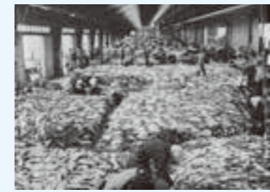
▲水揚げの様子 昭和30年代か？

浜っこかあちゃん市 荒浜の漁協婦人部では、1999年から「浜っこかあちゃん市」と称して荒浜漁港で水揚げされた鮮魚や魚を使ったさつま揚げや天ぷらなどを販売してきました。なかでも、その時期に獲れる魚から作ったさつま揚げは、年間を通じて大人気です。婦人部のメンバーは、底引き・刺し網の船主やノリ養殖をしている家のかあちゃん(奥さん)たちです。かあちゃんたちは、水揚げ後の魚の仕上げ作業やセリの準備などの忙しい合間をぬって魚を仕入れ、漁の休み日などに皆で調理します。試行錯誤で生みだし、味付けにもこだわって作るさつま揚げや鮭の包み揚げは、町主催のコンテストで賞をとった自慢の品です。震災前は、鳥の海荘や町内外のイベントで販売されていました。また、仙台市勾当台公園での定期的な出店では、心待ちにしている人たちも多く、瞬く間に完売という盛況ぶりでした。