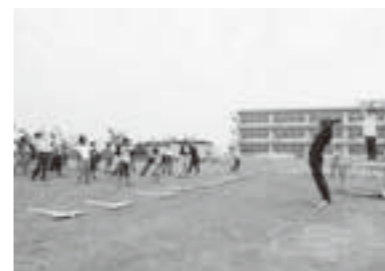
長瀬小学校では、新校舎を見ながらさわやかに体操しました

8月1日に「ラジオ体操会」が開かれ町内6小学校を会場に子どもから高齢者まで計992人が参加しました。 これは、平成14年にNHKの夏季巡回ラジオ体操が亘理町から全国放送されたことを機に、毎年8月1日を「亘理町ラジオ体操の日」と定め、健康保持と増進を図るため続けられています。 なかでも長瀬小学校では、7月に完成したばかりの新校舎を見ながら始めにラジオ体操の歌を全員で声高らかに歌い、ラジオ体操第一と第二に取り組みました。 終了後は、長瀬小学校新校舎の見学会が行われ、体操を終えて、すがすがしい表情を浮かべた参加者たちが、真新しい教室を眺めたり、屋上の避難外階段を確認していました。