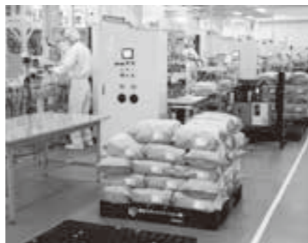
4階で投入された玄米は1階で梱包され出荷準備が整います