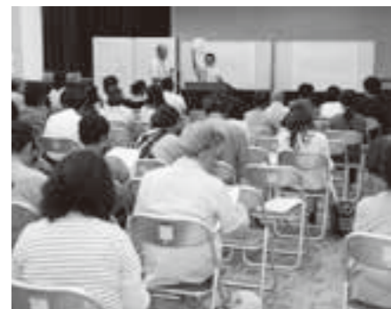
町担当者が抽選方法や決定後の手続きを説明しました