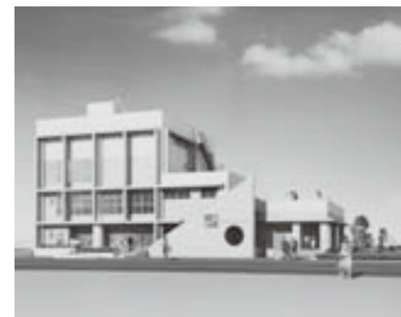
(仮称) 巨理町水産センターイメージ図