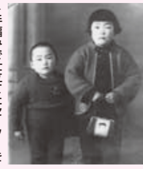
▶手編みで仕立てたセーターを重ね着した子どもたち。(昭和19年頃撮影)

編み物 昭和10年代後半から20年代前半は戦時下で、質のいい毛糸を手に入れるのは困難でした。長く厳しい冬には、子どもたちは兄や姉のおさがりのセーターを何枚も重ね着し、防寒着として、どんぶく(綿入れ)や、ちゃんちゃんこ(半纏)を着て外で暗くなるまで遊びました。毎日続けて着るため、ひじの部分がかすれて薄くなり、袖口が切れてぼろぼろになることもありました。家族のセーターをほどこいた編み返すことも多く、細くなった毛糸に他の毛糸や糸を加えて太さを出し、丈夫にしながら編んでいきました。