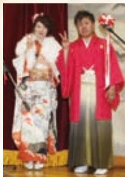
2人は成人式の司会を務めました

「そのためにも町民一人ひとりが日常に流されず、町の将来を考え、頑張っていれば町も輝き出すはず。温暖な気候と同じくらい心の温かい人が多いこの町なら、決して夢物語ではない。」とこれからの町づくりに対する考えを話してくれました。「広大な土地を有効活用していくべき。今から考えなければ、あつという間に開発から取り残されてしまう。」熱い思いは尽きることがありません。