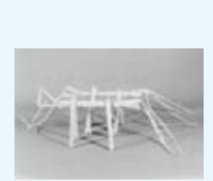
▲七夕のウマッコ(逢隈蔵地区)

七夕は七月七日の行事として知られていますが、前日の六日から庭や門口に七夕飾りを立てる風習がみられるものがあります。また、今ではほとんど見ることができなくなりましたが、七夕馬を作る風習もありました。これは、コモ草や稲藁あるいは麦藁などで馬の形を作り、七夕飾りや母屋、厩の屋根に一つ対して供えるものです。写真は、逢隈・蔵で作られたコモ草製の七夕馬です。ここではウマッコと呼ばれ親しまれてきました。素朴なその姿は、愛らしい郷土玩具のようです。