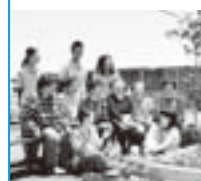
今月の表紙 仙台大学の学生と中央工業団地仮設住宅のみなさん。(13ページニュース&ニュースをご覧ください)