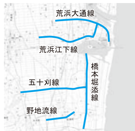
亘理町復興計画図より

総事業費：16億4,543万2千円 配 分 額：13億1,634万5千円 H24~26年度分 早期復興に向けて市街地整備事業と連携して行い、復興に相乗効果を与える事業やその事業の促進に寄与する事業のための経費です。