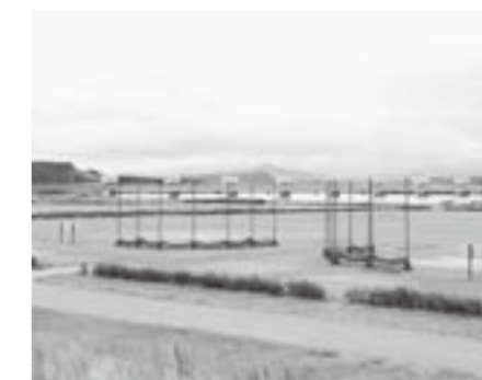
除染がはじまるあぶくま公園