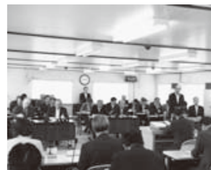
巨理町議会一般質問のようす