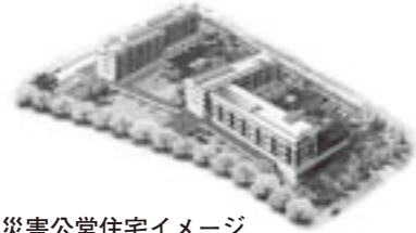
災害公営住宅イメージ

総事業費：103億1,823万6千円 配 分 額：90億2,845万6千円 H23~25年度分 震災で住宅を失った方に対して、災害公営住宅を整備し、安定した生活環境を早急に提供します。