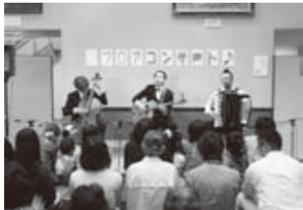
ヨーロッパを想像させる演奏に聞き入る来場者

この日は、「虚無僧円舞曲」や「僕の左手・君の右手」など十曲あまりを披露、ギター・チェロ・アコーディオンが奏でる演奏はまさにヨーロッパを想像させ、来場者はパリのカフェにいるような雰囲気味わっていました。