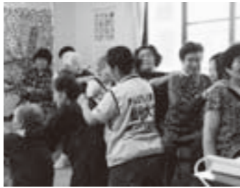
笑いがたえない茶話会

健康づくり茶話会は、週二回、月曜日は中央工業団地仮設住宅集会所、金曜日は公共ゾーン仮設住宅第2集会所で午前十時から開催されますので、ぜひご参加ください。FMあおぞら二時台で毎日放送している仙台大学地域健康づくり支援センター監修の「あおぞら体操」も、家庭で気軽にできる無理のない運動ですので、うっさぎとカメラの伴奏に合わせて歌いながら実践してみましよう。