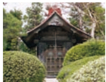
国登録有形文化財「老松永田醸造店舗(上)」 「老松永田醸造稲荷社鞘堂」 (H14年撮影・現在は保護のため防雨対策が施されています)