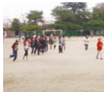
チャレンジランニングの様子。休み時間、それぞれのめあてに向かって走ります。

ルブルとは、子どもたちの健全な成長に必要な「しっかり寝る、きちんと食べる、よく遊ぶで健やかに伸びる」からとったものです。