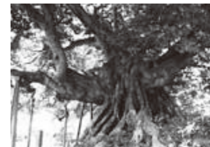
※境内にはもう1本シイノキがあり、こちらは推定樹齢300年と言われ町指定の天然記念物に指定されています。

この称名寺にあるシイノキは、昭和18年に国の天然記念物に指定され、推定樹齢700年を超えています。