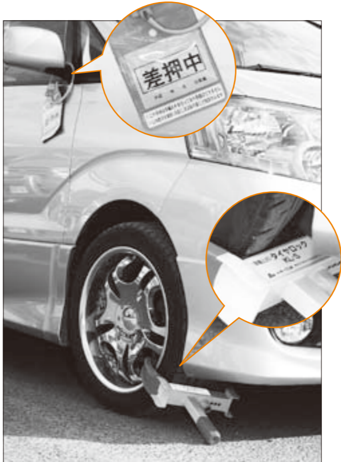
タイヤロック装置による自動車の差押え

納期限が過ぎても納付のない人に對し、文書催告書の送付、電話催告、自宅訪問などを行います。