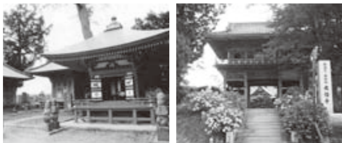
※今は警備の関係で霊屋の周りには柵があります。 ※山門は改修が行われたばかりです。

また、初代成実が南の小高い一画を巨理伊達家の御廟所と定め、14代邦成が北海道へ移住するまでの13代の領主と夫人の御霊がここに眠っています。成実霊屋は1月16日と8月16日の年2回御開帳しています。