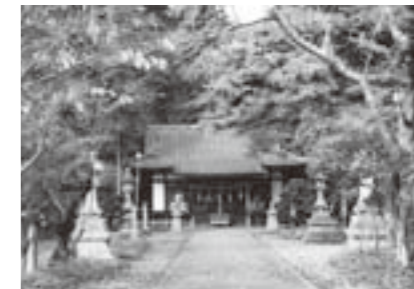
※巨理神社は北海道へ移住しなかった人々が成実の功績を伝えるため建立されました。

また、戊辰戦争の降服式がこの地で行われ、巨理伊達家の北海道移住により要害としての役目を終えました。