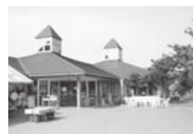
おおくまふれあいセンター 営業 9:30~19:00 (1月1日~3日休業) ☎0223-34-9687

逢隈の国道6号沿いにある「おおくまふれあいセンター」は、JAの子会社(株)ライフサポートわたりが運営する農産物中心の直売所です。前頁で紹介した春菊やりんごをはじめ