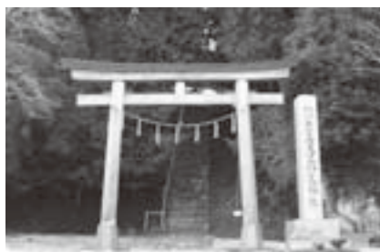
※町内で現存する最も古い神社です。

今からおおよそ1900年前の景行41年(111)に日本武尊が、武神の武甕槌神を祭ったのがはじまりといわれる由緒ある神社です。平安時代の記録『延喜式』に記載された神社で、このほか町内には鹿島伊都乃比気神社(不明)、鹿島緒名太神社(逢隈小山)、阿福河伯神社(逢隈田沢)が記載されています。