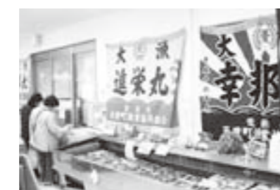
鳥の海ふれあい市場 営業 9:00~19:00 (定休日なし) ☎0223-35-2228

で、彼岸やお盆には遠方からわざわざ買いに来る人もいます。また、国道に面していることから、道の駅的な感覚で立ち寄る人も多く、自慢のアイスクリームや焼きたてパンは口コミで広がった人気商品のひとつです。