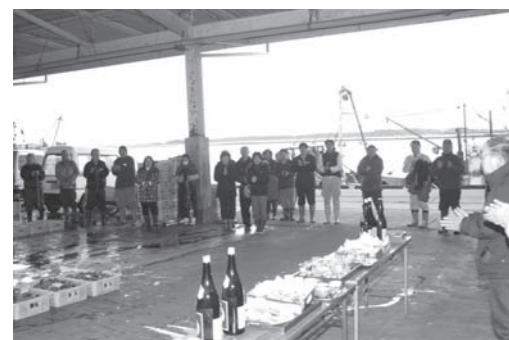
三本締めで一年の大漁を祈る関係者