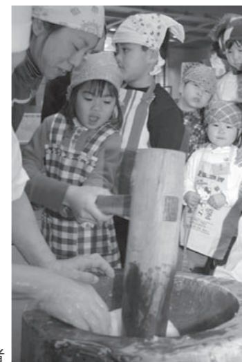
餅つきを体験する参加者

また餅つきでは、杵の重さに負けじと一生懸命踏ん張って餅をついていました。参加者は、つきたての餅を食べながら「自分でついたお餅はおいしいね」と笑顔で話していました。