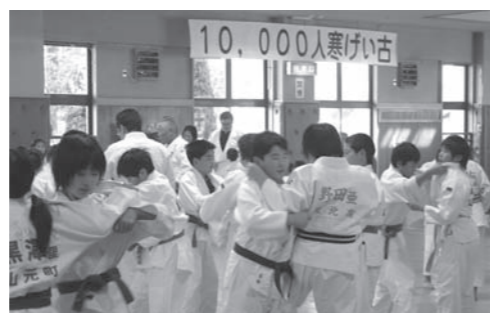
稽古に励む団員たち

今年の寒稽古は、巨理郡柔道協会の呼びかけで巨理郡内の小中学生約70人が参加、受身や打ち込みなどの基本練習を行い、気合の入った掛け声が道場に響き渡っていました。