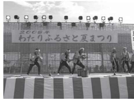
▲巨理枅取り舞 (平成20年わたりふるさと夏まつり)