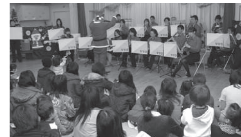
巨理ウィンドシンフォニーの演奏を楽しむ参加者たち