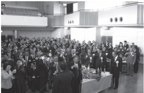
新年の門出を祝う参加者