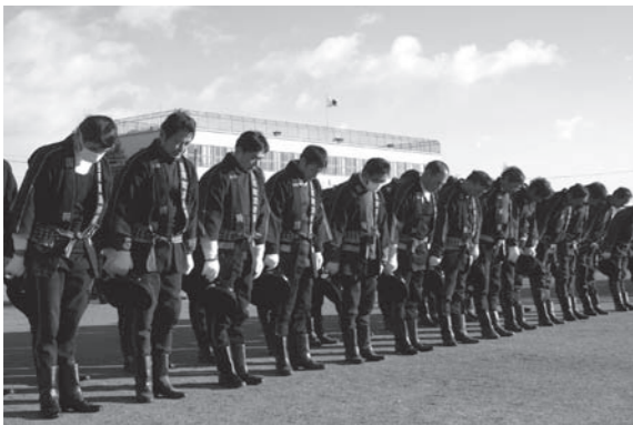
一年の無火災を祈願する消防団員