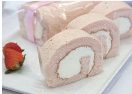
奨励賞 「いちごろーる」 ジョアンナ菓子店