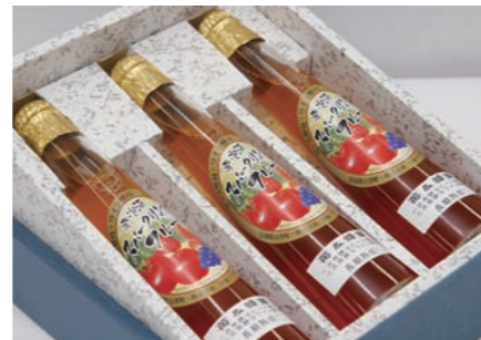
優秀技術賞 「発泡酒スパークリングフルーツ いちご&蜂蜜」 株宮城マイクロブルワリー