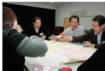
この日はワークショップを行い、気軽に話し、語れる環境の中、亶理町の「好きどころ」、「気になるところ」などの意見を出し合いました

みなさんも関心のあることを洗い出し、地域をどうしたらよいかを考え、取り組みやすいものから行動してみませんか。