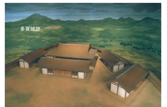
▲参照 国司の館(多賀城市館前遺跡)