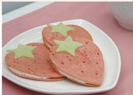
最優秀賞 「ソフトサブレ もういっこ」 お菓子のアトリエリモージュ