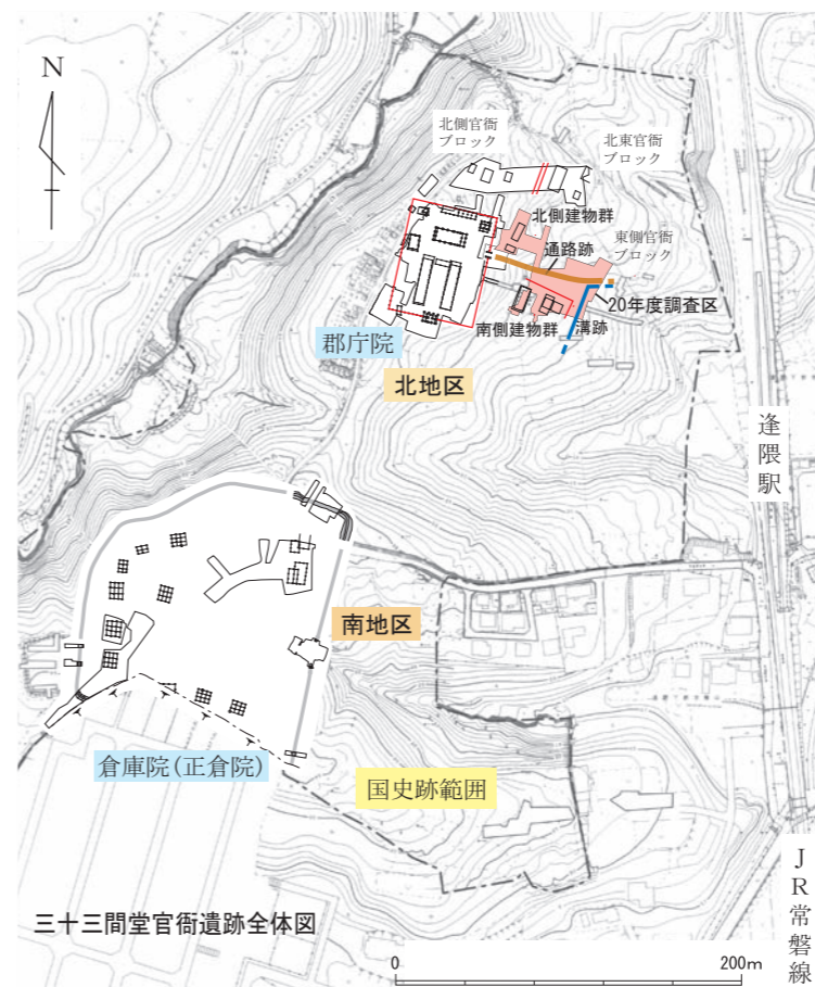
三十三間堂官衙遺跡全体図