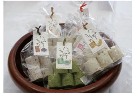
アイデア賞 「ハッピーシュガー」 みやぎのあられ(株)