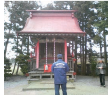
▲文化財の防火査察 平成20年1月に湊神社で行われたときの様子

この文化財防火デーの前後に、全国各地で文化財の防火訓練や防火査察が行われます。巨理町では毎年、文化財管理者の立会いのもと、消防署と文化財保護委員による防火査察を行っています。指定文化財には必ず消火器などが備え付けられることになっており、不備な点があれば改善するようにしています。また、指定は受けていないものの、地域にとって貴重な建造物なども合わせて査察を行います。文化財保護の啓蒙に努めます。文化財は建造物に限りません。