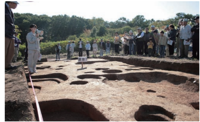
現地説明会のようす

昨年九月から十一月にかけて、平安時代前半の「陸奥国亶理郡衙」―郡役所跡と考えられている史跡三十三間堂官衙遺跡(逢隈下郡)の発掘調査を行いました。今年度は遺跡北東部、役所の中核施設となる郡庁院の東部約千五百平方メートルを対象として調査を行いました。その結果、郡庁院の東門から東に延びる通路の両側で新たに二つの建