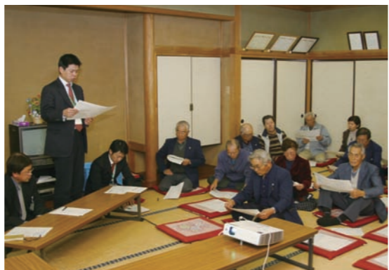
吉田西部地区での説明会のようす

年頭にあたり、町民皆様のますますのご健勝とご多幸をご祈念いたします。ごあいさつとさせていただきます。