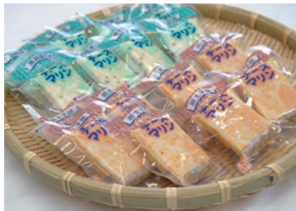
奨励賞 「チーズマリン2種」 株馬上がまぼこ店