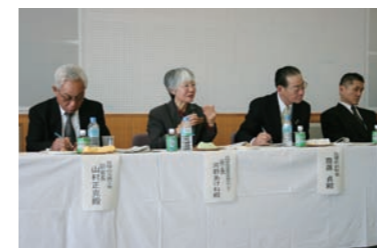
審査は9人の審査委員で行われ、商品開発に大切な特徴や販売予定価格などを質問していました。また、ネーミングなど商品をアピールするためのアドバイスをもしました