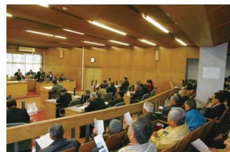
議員と町執行部の質疑応答に聞き入る傍聴者(13日)