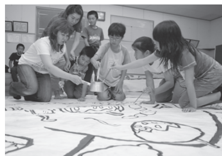
山車絵に親子で口を塗る参加者

今年「将来のわたり」と「まつり」をテーマに山車絵の原画を町内小学生に募集したところ、四百五十人から応募