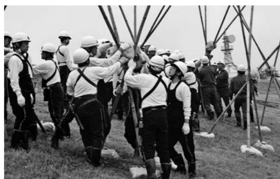
五徳縫工法の訓練をする水防団員