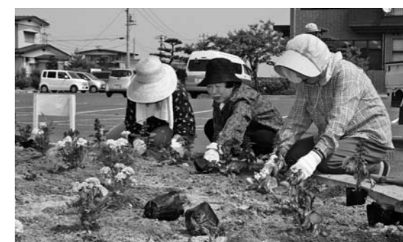
花の植え替えを行う亶理町老人クラブのみなさん(吉田支所前花壇)