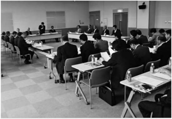
14市町村の首長と担当課長が出席して行われた 仙台都市圏広域行政推進協議会