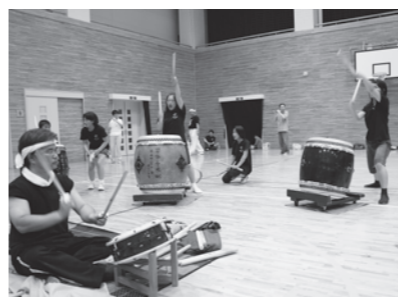
本番さながら熱のこもった練習

また、七年前からわたりふるさと夏まつりのために、町内外のおはやしや踊りなどの団体と運営委員会を立ち上げています。これは夏まつりを盛り上げるためで、今年は一十五団体総勢250人でパ