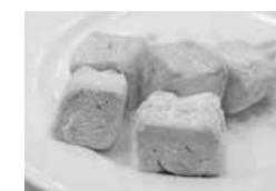
平成 18 年度優秀デザイン賞 「いちごのマシュマロ」 侑渡部菓子店