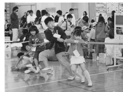
遊びコーナーで楽しむ子どもたち