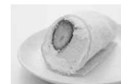
平成 18 年度最優秀賞 「シルキーケーキ」 お菓子のアトリエ リモージュ