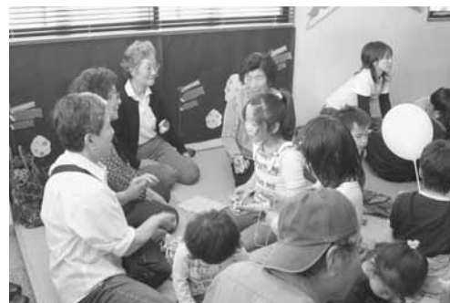
お手玉・あやとりの指導を受ける子どもたち