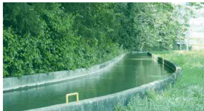
新緑の中を流れる用水路(逢隈地区)

水路は八月まで常時満水になっていても危険です。特に子どもたちは、水路付近で遊ばないよう、地域のみなさんの声かけをお願いします。