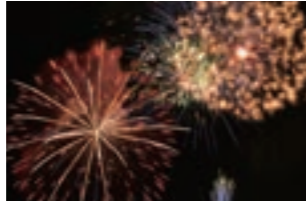
【8月第1土曜日】 なとり夏まつり