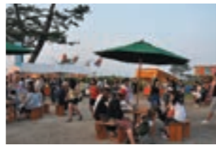
【7月下旬】 すきですやまもと夏祭り