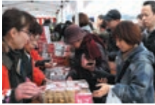
【3月上旬】 伊達なわたりまるごとフェア