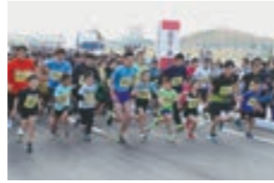
【11月中旬】 わたり復興マラソン大会