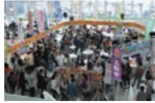
【秋～冬】 うまいもん名取in仙台空港