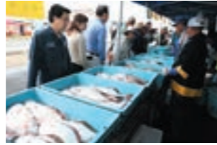
【10月中旬】 荒浜漁港水産まつり