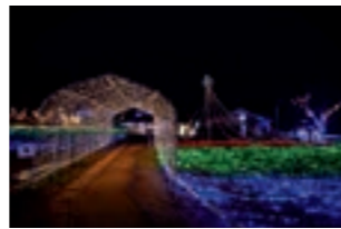
【12月中旬～1月中旬】 コダナリエ