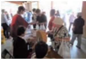
【6月上旬】 やまもと夢いちごの郷 ふれあい市