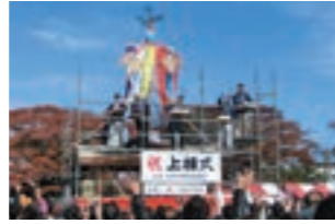
【11月3日(文化の日)】 ふるさと名取秋まつり