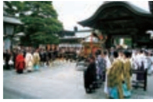
【旧暦2月の初午】 初午大祭(竹駒神社)