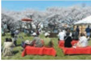
【4月第2土曜日】 なとり春まつり