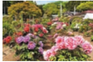
【5月8日～21日】 花まつり(金蛇水神社)