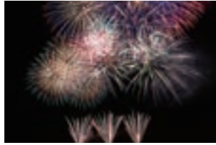
【8月15日】 わたりふるさと夏まつり