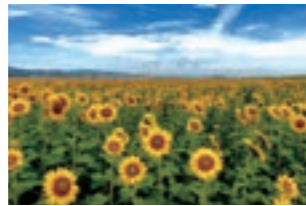
【7月下旬～8月中旬】 やまもとひまわり祭