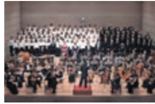
【12月上旬】 「みんなで歌う第九の会」演奏会