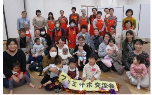
参加していただいた皆さんありがとうございました。