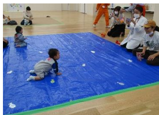
お子さんの頑張る姿を みんなで応援しました