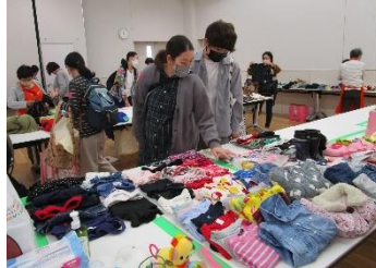
交流会&おさがりコーナーは 妊婦の方も参加できます