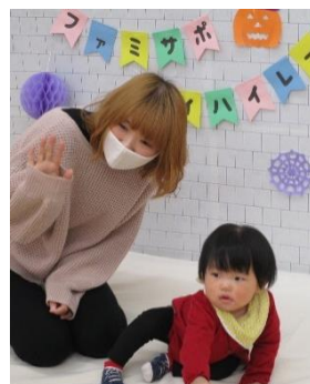
親子ショットも撮影しました。