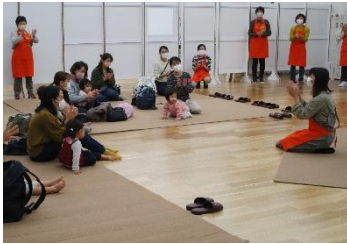
手遊び「どんぐりころちゃん」

協力会員による絵本の読み聞かせ、ウクレレ演奏、手遊びを楽しんだ後は、会員提供のおさがり品の無料譲渡コーナー。子ども服、おもちゃ、ベビー用品など今回も沢山提供いただき、会場いっぱいにおさがり品が並びました。会員や参加者同士でアドバイスしあう姿も見られ、楽しい交流ができました。