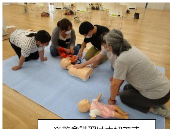
※救命講習は大切です。