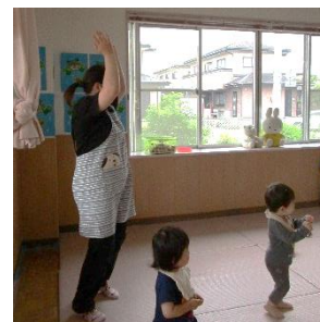
※保育所体験 元気に遊びました。