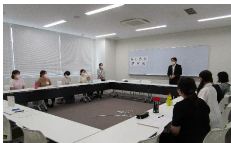
※閉講式 皆さんお疲れさまでした。 ファミサポ活動にご協力お願いします。