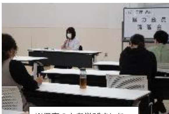
※保育の心を学びました。

昨年度はコロナウイルス感染拡大の影響で半分の日程の講座となりましたが、今年度はすべての講座が終了できました。山元町と初めての合同開催となりましたが、両町の交流を深めながら和気あいあいとした雰囲気の中で、講習会ができました。