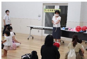
バルーンアートショー

おさがり品は会員より今年もたくさん提供いただきました。「ベビー用品や子供服はすぐに使わなくなるので、おさがりは助かる」と、参加者の方からも喜びの声をいただきました。