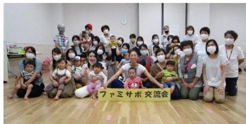
みんなでハイ、ポーズ！