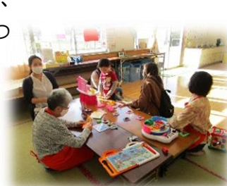
協力会員と子育ての会話も