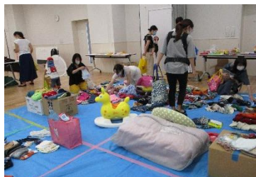
おさがりコーナー