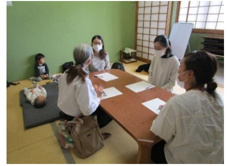
中央公民館でのマッチングの様子 (協力・利用会員の事前顔合わせ)

基本、お子さんの預かりは協力会員の自宅で行いますが、中央公民館や逢隈働く婦人の家でもお預かりができるようになり、利用しやすくなりました。その他自由来館できる時間帯であれば、中央児童センターなどでも活動可能です。お気軽にご相談ください。