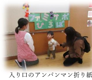
入り口のアンパンマン折り紙は