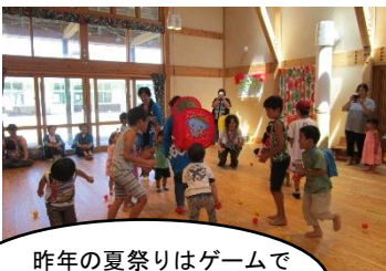
昨年の夏祭りはゲームで 盛り上がりました