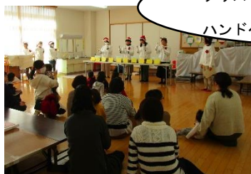
クリスマス会では協力会員さんによる ハンドベルの演奏にも癒されました