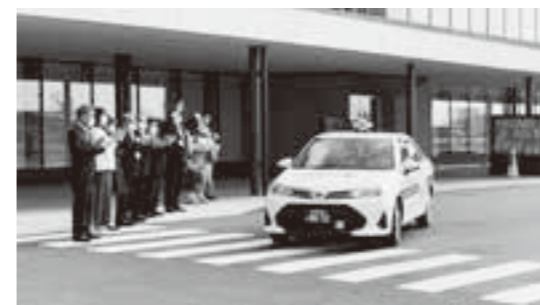
巨理町デマンドタクシー

問 昨年8月から運転免許を返納した65歳以上の町民がデマンドタクシーを1年間無償利用できる制度がスタートした。制度の利用状況は。 町長 4月末でのデマンドタクシーの利用総登録者数は918名、うち免許返納者の登録数が60名です。