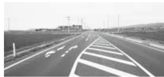
農道悠里線との交差点部

問 変更・中止等に伴う減額分を、コロナ対策に追われている医療従事者の支援に充てては。 町長 地域医療の現状を把握し、医療従事者に地方創生臨時交付金の活用を含め、支援を検討します。