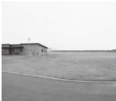
鳥の海公園多目的広場