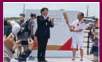
聖火リレー点火式