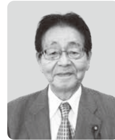
高野 進 議員

問 新型コロナウイルスが猛威を振るっており、当町でも感染者の増加が見受けられる。今年の感染者は6月15日現在49名。今年も町行事やイベントの中止または変更等をする考えは。 町長 感染リスクの対応が整わないイベントは原則中止または延期、方式の変更等を含め慎重な対応をする方針です。