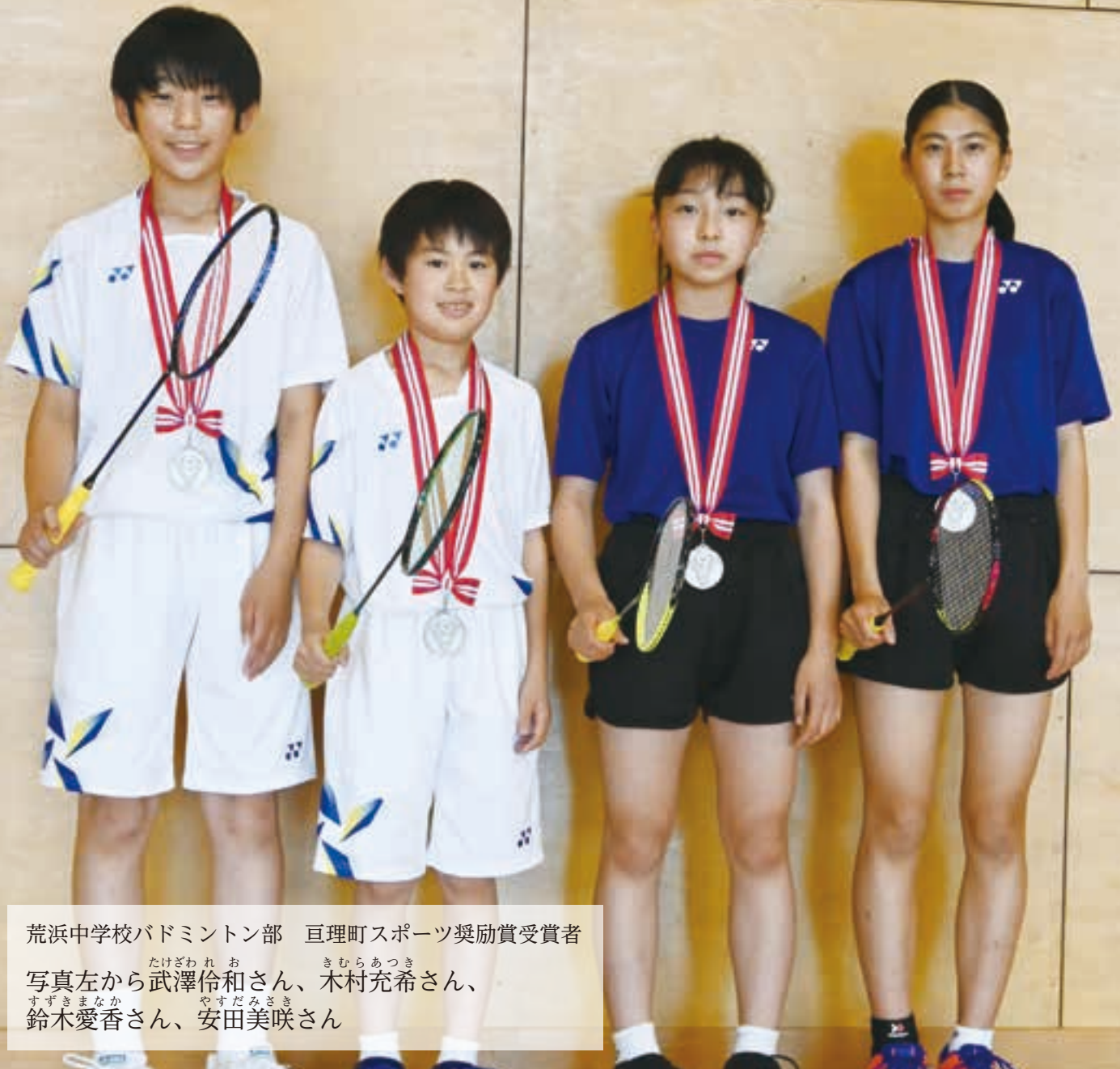
荒浜中学校バドミントン部 巨理町スポーツ奨励賞受賞者