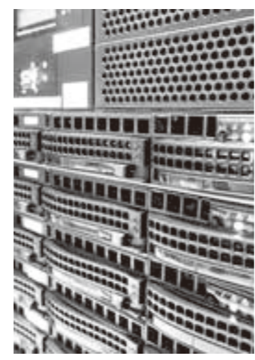
日々進歩している情報化社会

問 行政情報化計画推進の進捗状況は。 町長 証明書のコンビニ交付や庁内のグループウェアを導入済みで、今年度、公式ホームページのリニューアル、ペーパーレス会議、マイナンバーカード交付予約・管理システム、RPA(※2)の無償トライアルなどに取り組んでいきます。 再質問 ペーパーレス会議導入の効果は。 企画課長 試験的に27台のタブレットを導入し、会議で使用する用紙代と人件費の削減を予定しています。