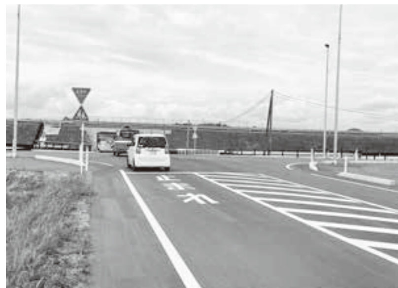
渋滞が発生した、荒浜大通線

再質問 避難指示を出した場合、避難道路を優先し、県と協議して渋滞を解消すべき。 町長 一方の道路を優先すると他方の避難経路の円滑化が妨げられます。緊急時に優先度を変えると渋滞の恐れがあると考え、県と協議する予定はありません。 再質問 岩沼方面には海へ向かうため危険であり、巨理大橋から巨理方面の車は、南より西に誘導した方が東部道路に近く、荒浜大通線の避難誘導が確保でき、荒浜地区と通行する全員の安全確保になるのでは。