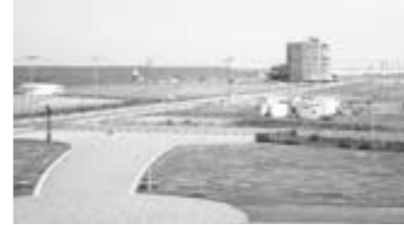
期待される荒浜観光資源

問 町の優先事業は。 町長 初年度は、プロモーションや環境整備を行いながら、防災関連事業を優先に考えています。 再質問 即効性の事業が必要不可欠。 町長 防災で学びの場ができればと考えています。 問 自主提案事業の財源と、全体事業費は。 町長 企業版ふるさと納税と一般寄付等で。10力年で総額40億円を想定しています。 問 施設管理運営事業において、地元雇用(シルバー人材センター)を切り替える理