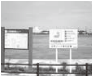
公共ゾーン防災広場

問 防災広場は、なぜ大規模火災のみの活用か。マンホールトイレの活用は。 町長 東日本大震災の浸水区域と近接しており、西側への避難を推奨しています。また阿武隈川が氾濫した場合、役場庁舎が孤立する可能性があります。マンホールトイレは、一時避難者、自衛隊、災害ボランティア等の活動拠点時に活用します。 問 町民のニーズに対応できるよう活用できないか。 町長 町民が安心して快適に広場を利用できるように努めます。