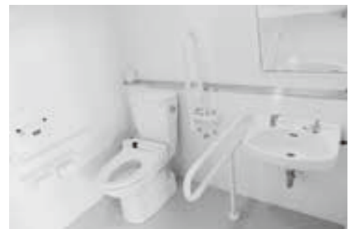
長瀬小学校多目的トイレ

問 施設は老朽化しており、今の施設での現行の制度で新規に営業の許可申請は難しい。このような状況で給食業務が行われていることをどのように思っているのか。 教育長 施設が老朽化し、調理等の作業スペースが狭く、調理作業や衛生管理に苦勞していることは十分承知しており、近い将来には建設が必要と考えています。 問 土地面積の関係上、今の場所に新しい給食センターは造れないと考えるが、建設地は決まっているのか。 町長 まだどこにするかというのは確定をしているわけではないです。