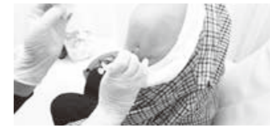
ワクチン接種の様子

問 新型コロナウイルスが猛威を振るっており、当町でも感染者の増加が見受けられる。今年の感染者は6月15日現在49名。今年も町行事やイベントの中止または変更等をする考えは。 町長 感染リスクの対応が整わないイベントは原則中止または延期、方式の変更等を含め慎重な対応をする方針です。