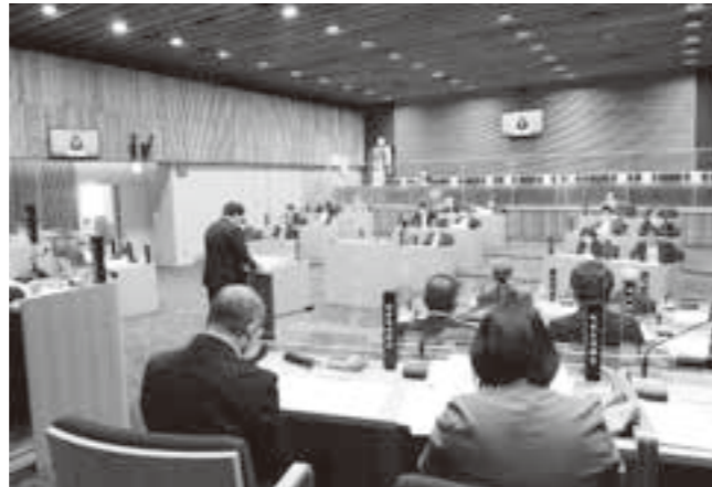
山田町長、提出議案の説明

議案33 工事契約の締結 悠里館デッキ部にエレベーター新設、通路に屋根を整備する巨理駅バリアフリー事業