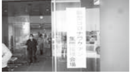
ワクチン接種会場 (保健福祉センター)

表することが責務となつています。 問 在宅介護者への接種はどのように行うのか。 町長 個別接種機関の、わたり往診クリニックが、往診している方へのワクチン接種を実施しています。 問 余ったワクチンはどのように活用するのか。 町長 集団接種会場でのキャンセル対応はワクチン接種に従事している職員で対応しています。