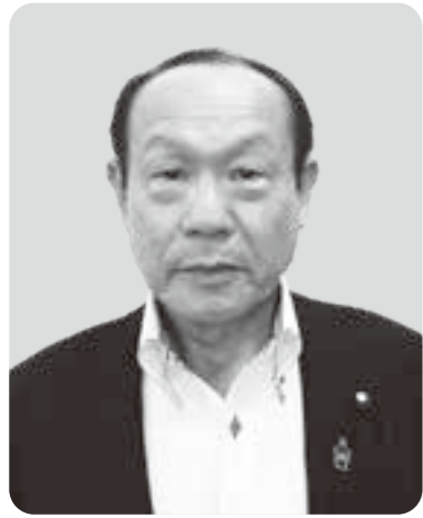
鈴木 邦昭 議員