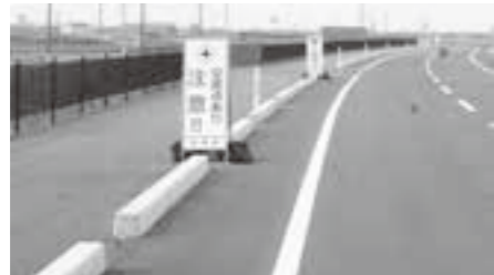
橋本堀添線の安全対策

問 整備された町道橋本堀添線との交差点が8力所あります。橋本堀添線を優先道路として安全対策を講ずるべきではないか。 町長 橋本堀添線は、避難道路としての役割を担うとともに、隣接する他の町道より幅員が広い。橋本堀添線が優先道路と考えるおります。各交差点にドット線(点線)を引くとともに、注意喚起の看板を設置して、安全な交通の確保に努めています。 問 現在、一時停止箇所の仮設標識板が橋本堀添線に設置してあるが、反対側の道路に移設すべきでないか。 町長 注意喚起の看板は、主に橋本堀添線側に「一時停止」の看板を設置しておりますが、これは地域住民の方より強い要望を受