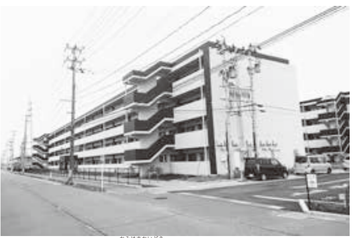
上浜街道災害公営住宅

問 高齢化の課題や災害公営住宅入居者の抱える問題意識は。 町長 高齢者の支援活動担当の地域包括支援センターと住宅を管理する施設管理課との連携強化を図り、問題の解決や不安の解消に努めます。 再質問 近傍同種家賃（※1）が、町内の民間家賃より高額であり（質）と言えるのか。 施設管理課長 災害公営住宅を同じ場所に同規模で建築した場合の費用を基に算出しており、本町には災害公営住宅規模の民間の建物