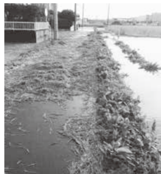
昨年の台風19号による住宅地の様子