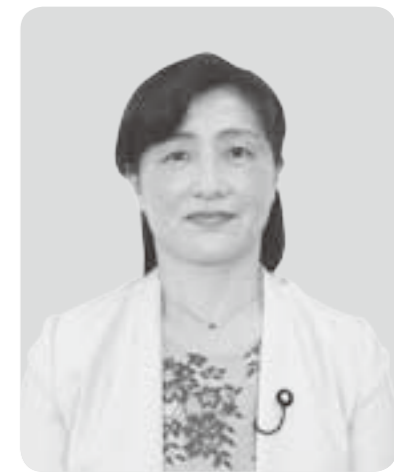
小野 明子 議員