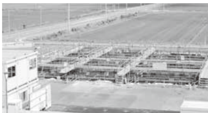
建設中の防災備蓄倉庫

問 755万円計上されているが商工会の負担は。 答 生涯学習課長 現時点で考えておりません。