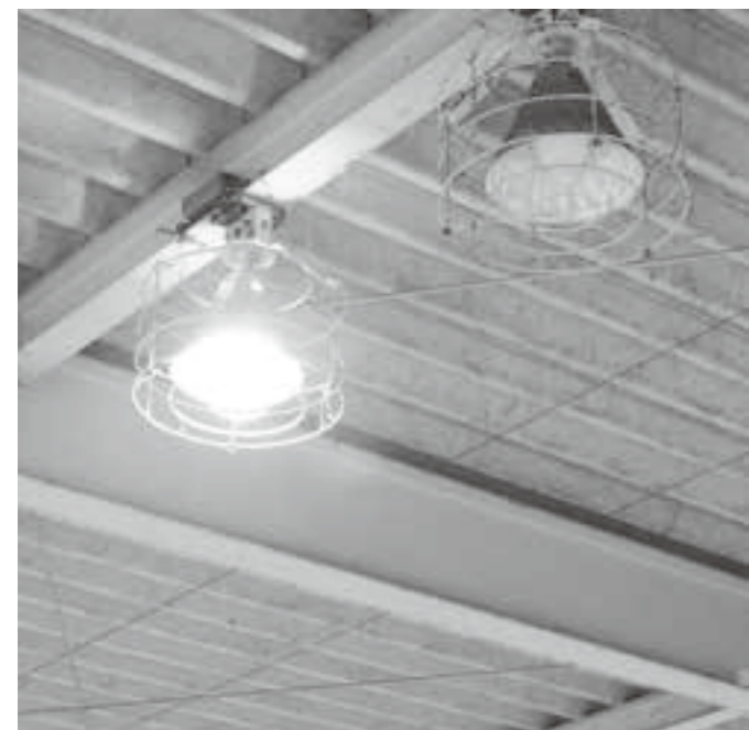
体育館の高圧水銀灯

再質問 都市建設課の関係する設備等をLEDに整備したことで、よってこれまでの電料に差が生じているのか。 都市建設課長 道路照明灯を240基LEDに交換した結果、年に770万円かかっていた電料が205万円となり約566万円の削減となっています。