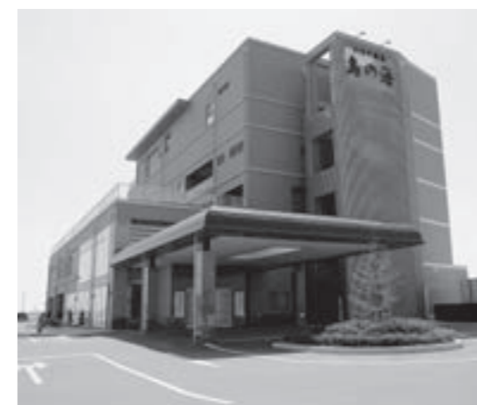
わたり温泉鳥の海

問 平成29年4月から「株式会社佐勘」を指定管理者とし、平成30年4月から宿泊やレストラン等を含め全館再開をした。そこで、9月末までの施設利用状況は。 町長 営業日数は175日で、入浴休憩者数の累計は6万4140名、1日平均369名で、累計金額は325万2千円です。宿泊者数の累計は2155名で、1日平均12名です。入浴者数には、宴会の休憩者数と宿泊者数は入っておりません。 問 議員等から、利用者数等に関し請求があった場合、開示してはどうか。 商工観光課長 定例会前の全員協議会で報告します。 再質問 誰でも条例に定めるところにより、請求することが出来るということが出来る。町