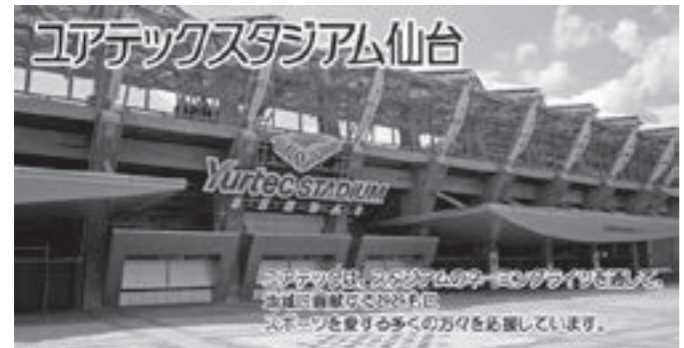
ネーミングライツ 本町の第1号は・・・

企画財政課長 今年度、7000万円が見込まれていることから、当面は1億円を目指します。