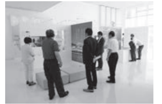
大船渡市視察の様子

係団体の主体的な取り組みを支える仕組みづくりが必要であると捉えた。大船渡市では、消費者から選ばれるため、水産物の漁獲から流通、加工までの一貫した衛生品質管理を行い、高品質の水産物を供給する「高度衛生品質管理地域づくり(HACCP)」を導入している。また、ITを利用した効率化と情報発信を行い、卸売業務の効率化と衛生・鮮度管理の充実強化に努めている。