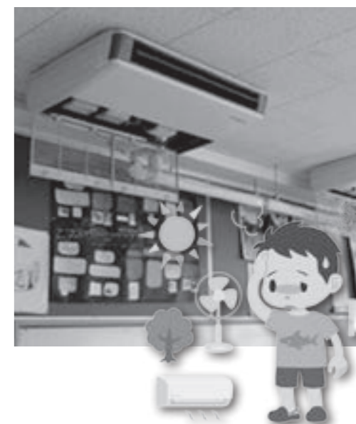
全校に設置されるエアコン