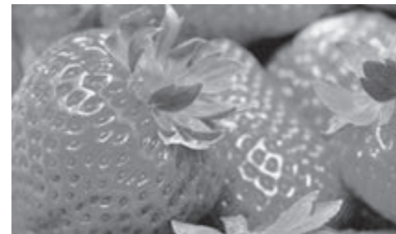
人気No.1・魅力ある返礼品