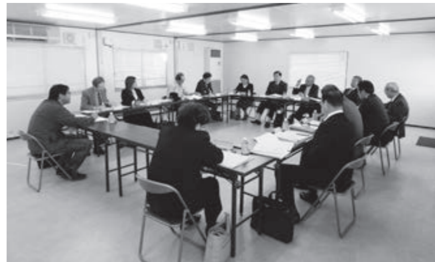
モニター会議の様子

平成30年10月26日、役場西会議室で、第1回議会モニター会議を開催しました。モニターの皆様には、定例会や議会運営及び議会広報に関する貴重なご意見を、文書により提出いただき、議会運営委員、議長、副議長と意見交換を行いました。今後、議会運営の参考とさせていただきます。