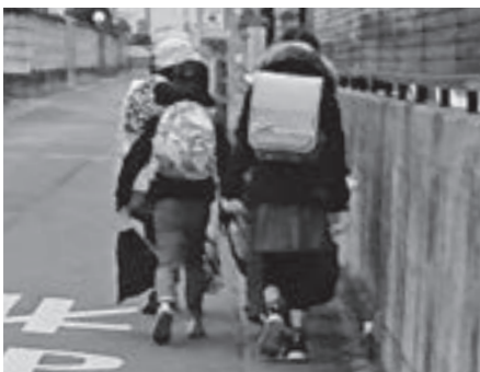
月曜日が特に重い

問 文部科学省は、「置き勉」(※)を認めるように全国の教育委員会に通知しているが、本町での取り組みは。 教育長 教科書を全部入れると約5キロです。授業で使わない教科書は極力置いてくるように家庭に協力を呼びかけていきたいと考えています。 問 2020年度から小学校でプログラミング教育が実施される。十分な準備が計画されているか。現段階での状況は。 教育長 2年後に小学