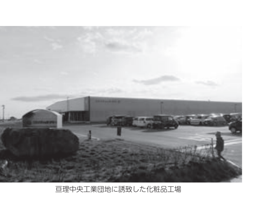
巨理中央工業団地に誘致した化粧品工場

問 企業誘致アドバイザー委嘱の考えは。 町長 一部自治体で、民間企業退職者等、経験豊かな人材をアドバイザーとして迎え入れていることは承知しています。東京等在住の本町関係者でアドバイザーとして精通している方がいれば検討します。