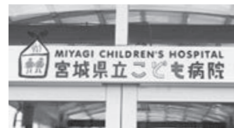
宮城県立こども病院

問 我が国では小児の病死原因の第1位はがんとなっている。本町での小児がんの早期発見の取り組みは。 町長 現在、東北大病院を中心にかかりつけ小児科、県立こども病院を初めとする総合病院との連携が図られ、治療体制は向上しております。 問 小児がんの中には網膜芽細胞腫(※)という目のがんがある。本町の乳幼児健康管理表に「白色瞳孔」を追加することについての考えは。