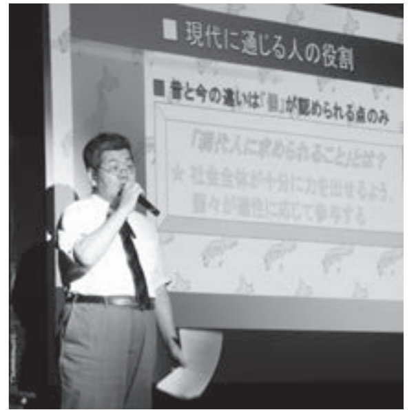
男女共同参画フォーラム「町民のつどい」