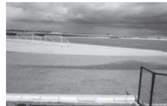
鳥の海公園サッカー場

問 スポーツ行政は。教育長 多種多様な事業展開をしています。 再質問 グラウンド使用無料化等は。(名取・山元は住民無料)生涯学習課長 受益者負担の観点から無料化は考えておりません。 再質問 高齢者の大会等の参加に町民バスの活用は。(山元町無料で送迎) 企画財政課長 町民バスの目的、交付金措置等から慎重に考えます。 再質問 新設サッカー場の減免は(時間三千円)。 生涯学習課長 県大会を巨理で行う場合、今後は事前相談の中で検討したい。