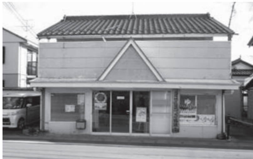
巨理地区まちづくり協議会

再質問 巨理地区がモデル協議会をつくる良いエリアだと思うが。 町長 巨理は独立して中町に事務所を構えています。今後巨理地区のまちづくり協議会を含めた組織体制を考えていかねばならない。役場庁舎完成と同時に中央公民館から、教育委員会が新庁舎に移転することになる。空いた中央公民館に巨理地区交流センターを新たに設置し、巨理地区まちづくり協議会の再任用職員を雇用し、巨理地区交流センターが巨理地区まちづくり協議会の事務局を担うことを想定しています。