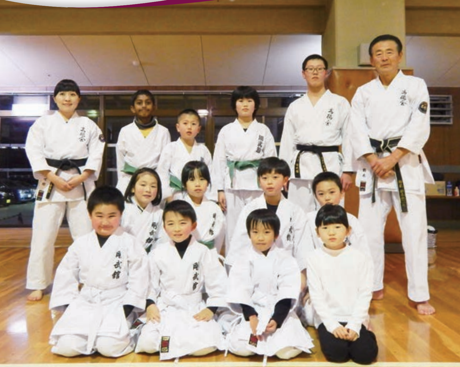
荒浜空手道剛武館スポーツ少年団 新春初稽古