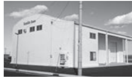
管理運営予定のシーサイドベース

提案理由 本町の観光と産業振興を図るため荒浜地区鳥の海に設置した産業交流多目的施設、通称シーサイドベースの管理運営の条例を制定するものです。