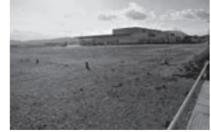
売却が決定した中央工業団地