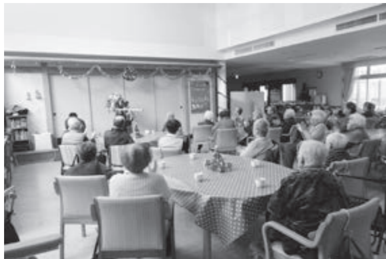
福祉避難所になる「かしま荘」

町長 福祉避難所との協定により町がかかった費用を負担する事になっていきます。 再質問 東日本大震災では福祉避難所が七ヶ所開設されたが費用を払った所と払っていない所が出たが、今後の対処方法は。 福祉課長 今後は各福祉避難所と協定書を結んでいるので支払いがないという様な事はありません。 問 熊本地震では、新潟中越地震の際と同じエコノミークラス症候群が発生し、教訓が生かされないまま多数の命を失った。本町でも後世に伝えていくために防災計画に明記して周知を図ってはどうか。