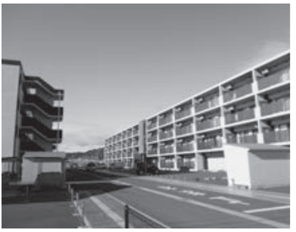
震災後に建設された上浜街道住宅

●財政調整基金からの繰入 10億6000万円 (財政不足から町の貯金を一部取り崩すもの)