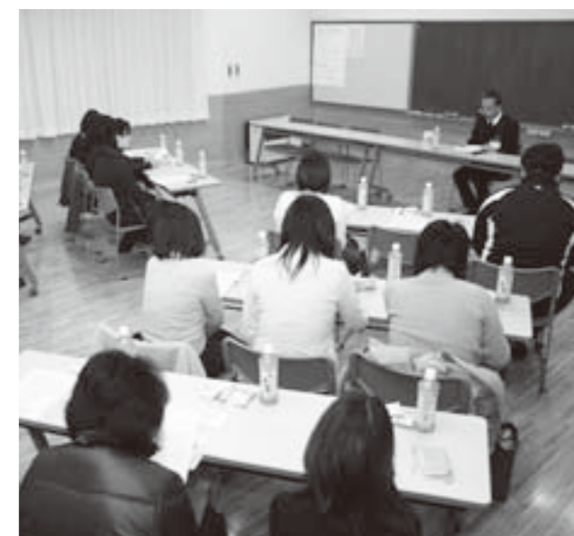
まちづくり出前講座の様子

町長 まちづくり応援隊の結成など住民主体組織の活動が活発になることは、地域の活性化や住民におけるまちづくりへの参加にもつながり、大変喜ばしいことです。 まちづくり協議会を立ち上げるにより、地区の活動拠点施設を充実させ、活動しやすいように努めるとともに、地域や各種団体の自主的な活動を積極的に支援していきます。