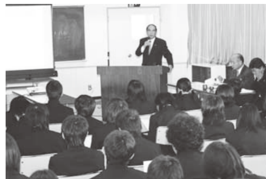
町長さんいらっしやい (吉田中学校)

まちづくりにかわる各種講座や講演会の開催、町民と行政との情報の共有化を図るための「巨理町まちづくり出前講座」を平成20年11月より35のメニューを設け、好評であります。