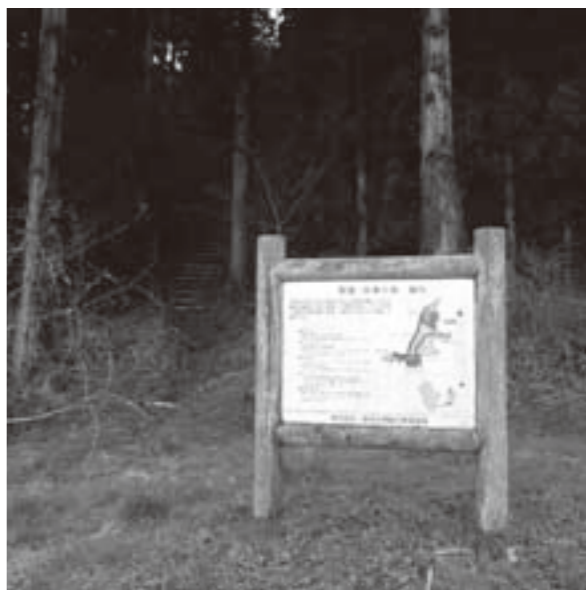
巨理中学校南側の四季の森

まちづくり企画提案の中で「わたり桃源郷」創生事業の提案があり、企画調整会議の中で四季の森周辺の一部に四季折々に咲く樹木の植栽についての意見もあります。今後、協働のまちづくりの一環の中で検討していきたいと思えます。