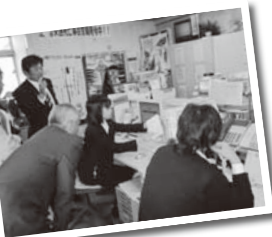
予約センターの運営状況を調査 (山形県川西町)

デマンド型交通運行の先進地である角田市、山形県川西町の事例効果等を調査した。両市町ともタクシー業者の車両を借り上げ、利用登録者の完全予約制により戸口から目的地まで無駄のない運行を行うことにより、従来の路線バス運行型と比べ経費の削減が図られている。予約がない時間帯のタクシー通常営業など業者にも配慮した運行となっており、料金についても住民からの苦情はなく、利用登録者は増加傾向にある。当町も乗合自動車運行開始から5年を経過し、当初計画である巡回乗合自動車及びデマンド型乗合自動車を運行するなど全体的な見直しが必要であり、地域実情に即した交通運行形態の確立を望むものである。