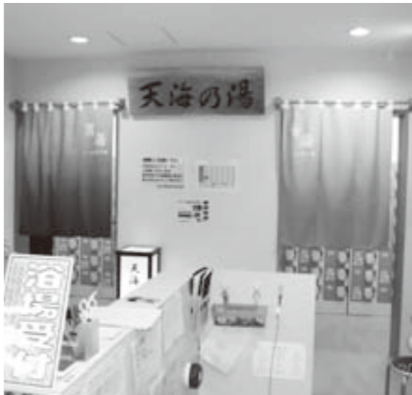
わたり温泉鳥の海オープン2周年キャンペーンが開催されています