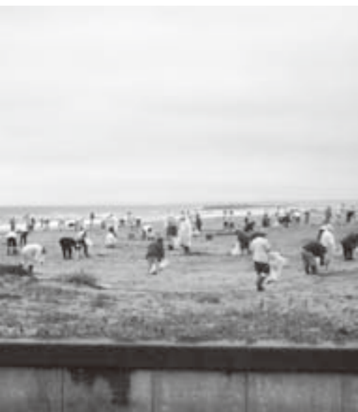
毎年7月の第一土曜日に行われる一斉清掃

問 奨学教育基金の積立残高は。 企画財政課主幹 21年度末で1億9,205万円になる見込みです。