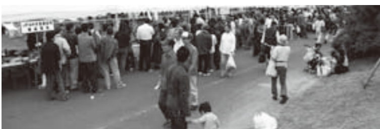
観光イベントはたくさんの方でにぎわいます (水産まつり)