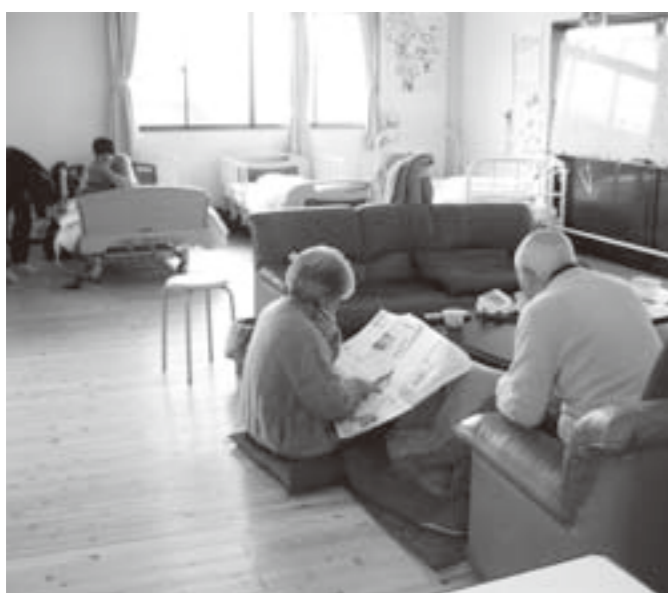
施設入所待機者の解消が求められています

町長 日就苑25人、第二日就苑130人、和多里ホーム3人、しんまち15人等となっておりますが、重複しているため実数は把握できないのが現状です。入居待機者の解消については、第4期互理町老人保健計画・介護保険事業計画の中で、特別養護老人ホーム60床、認知症対応型グループホーム18