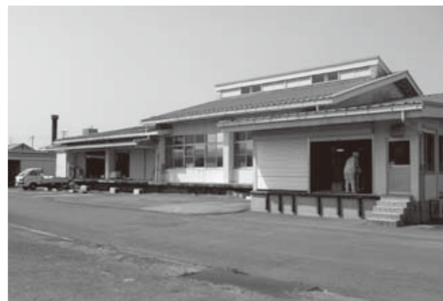
学校給食センター

問 図書館の管理運営に指定管理者制度を導入すべきでないかと考えるがどうか。 教育長 指定管理した図書館で直営に戻したところもあります。こうしたことからは、今後さらに業務委託や指定管理を実施している図書館を視察するなど情報を集めながら、図書館のあり方や利用しやすい図書館づくりのため検討をしていきたいと考えています。