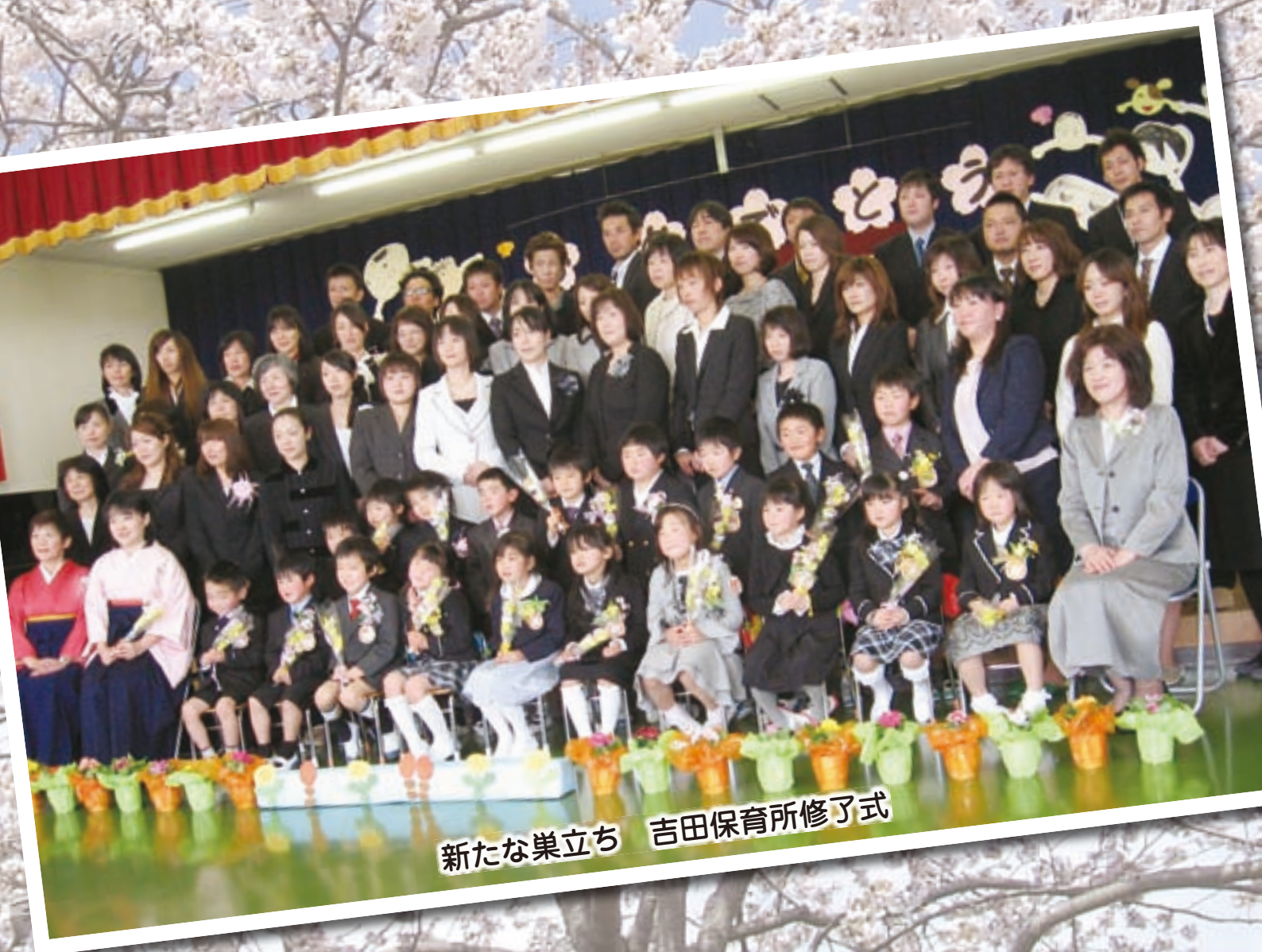
新たな巣立ち 吉田保育所修了式