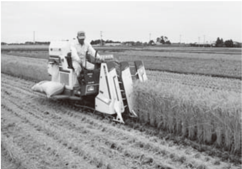
農政の転換は農家にとって大きく影響します