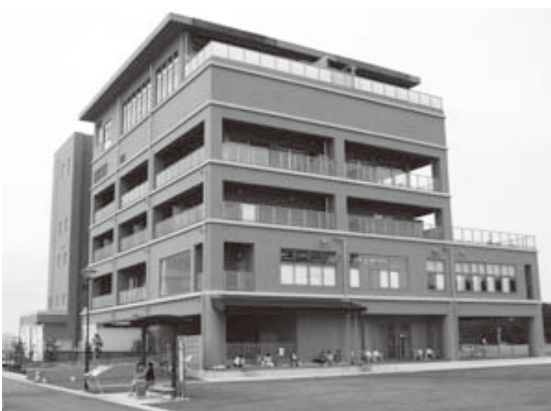
利用者が50万人を越えたわたり温泉鳥の海

問 町直営の経営形態を、民間移行へと検討してはどうか。 町長 想定しておく事項であることは認識していますが、当分の間は直営で行っていきます。