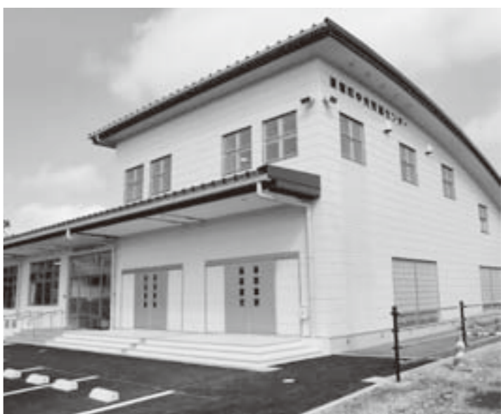
4月にオープンした巨理町中央児童センター

保健福祉班長 管理・運営費は788万円になります。緊急雇用創出事業において5人の臨時職員を採用しました。