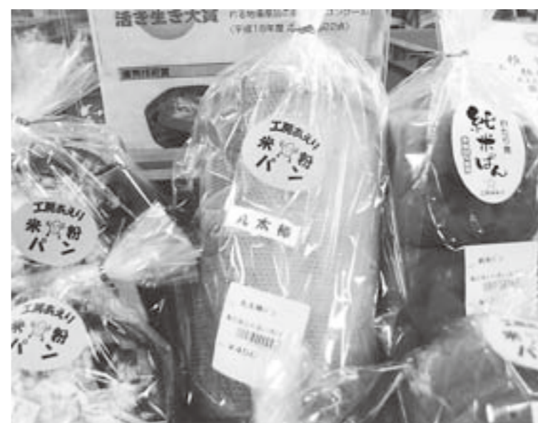
今後ますます米粉の利用が期待されます

町長 次期計画策定には、利用者負担等に配慮し、多床室も視野に入れて計画をしていきます。 問 介護保険申請から認定まで、どれくらい期間がかかっているのか。 町長 3週間から1カ月で認定となっております。申請者のために、迅速で最短な対応を心掛けていきます。 問 小規模多機能施設の設置促進について、どう考えているのか。 町長 計画の中で小規模多機能型の居宅介護施設についても、整備を行う計画になっていきます。事業を立ち上げる方には、町としても支援したいと考えています。 問 介護家族や高齢者世帯に対して、きめ細かい相談体制は。 町長 地域包括支援センター「やすらぎ」を開設し、高齢者の総合相談窓口として利用者の立場に立った運営を行っています。