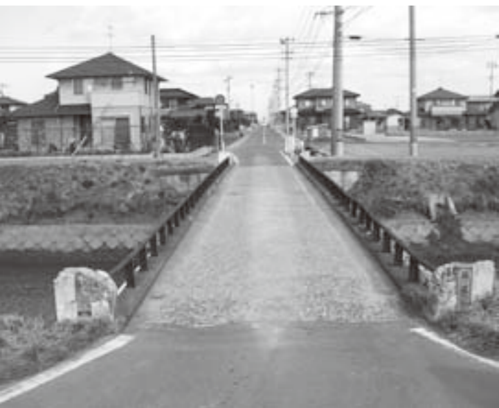
老朽化のため架け替え工事が行われる狐塚橋