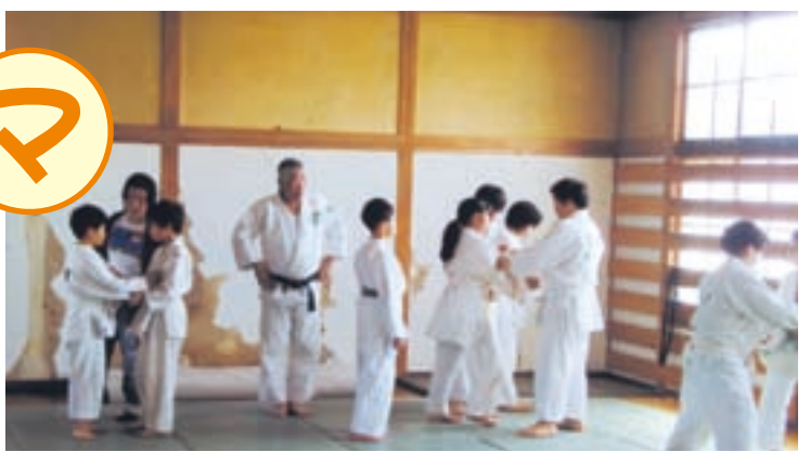
稽古がんばります!! (逢隈柔道場早川公園内)