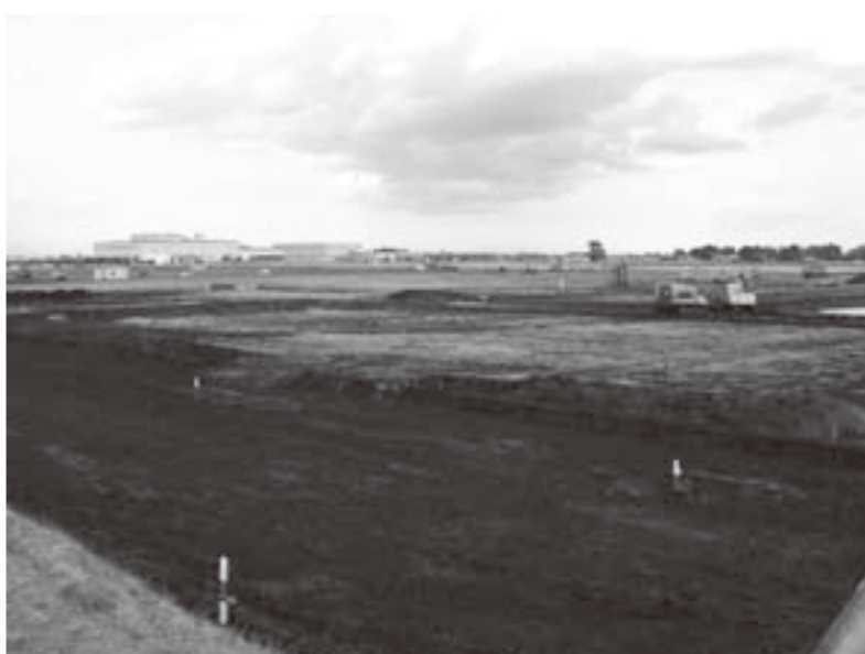
工事が進む造成地

問 借入金として工事請負、土地購入など約13億円、その他一般会計から、その回収できるのか。 町長 も繰り入れして立て替えている状況である。間違いないと回収できるのか。