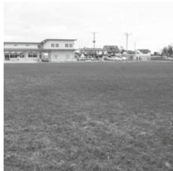
芝生により新たに整備された巨理運動場

問 全国瞬時警報システムの目的は。 総務課長 国民保護計画に基づいて、住民の安全安心を早急に情報提供するシステムです。 問 観光施設整備積立金の使い道は。 産業観光課長 観光施設の看板、フィッシュリーナなどの改修に使用します。 問 わたり温泉島の海の借入金にも返還の時期がくれば、充当していかなければならないと考えています。