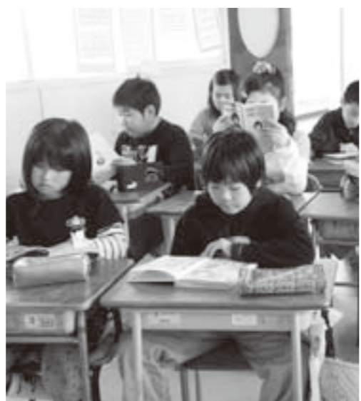
毎週火曜日と木曜日の朝に実施している「読書タイム」(荒浜小学校)

問 活字離れの現状をどのように認識しているのか。 教育長 学校の図書室へ足を運ぶ機会を担任の先生を通し、本を読む楽しさ、ストーリーの面白さを味わう機会を作っています。