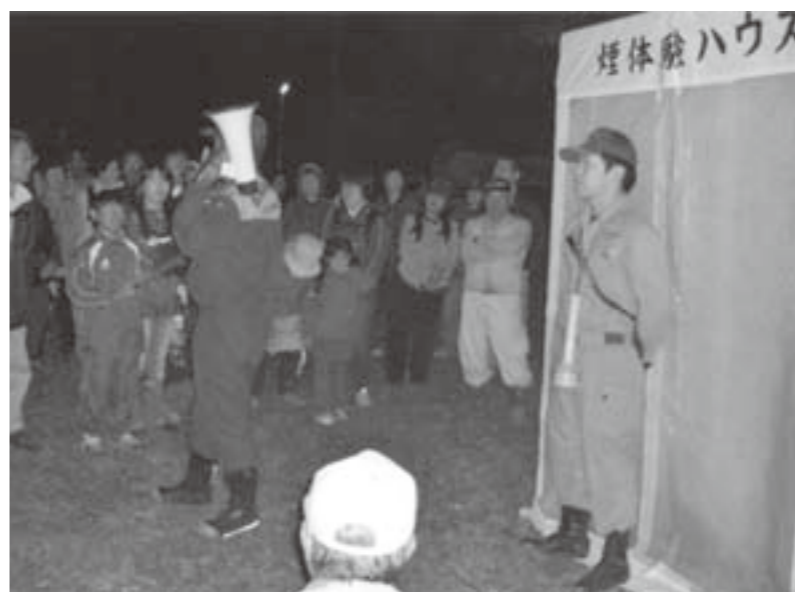
防災夜間訓練（南町北区）