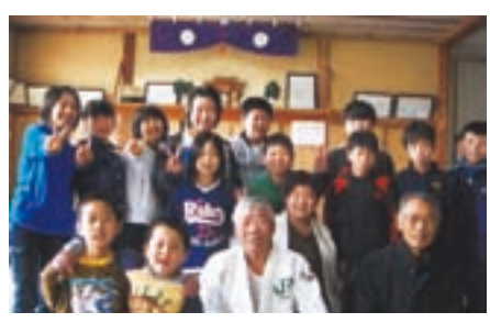
6年生を送る会にて

柔道をとおりて、青少年の健全育成を目的に逢隈在住の柔道を経験した先輩や柔道を愛した人たちが起ち上がり、昭和57年4月に逢隈柔道スポーツ少年団が結成されました。当時は、道場がないため、逢隈農協4階のトレーニングルームを借りて、団員40数名が参加し稽古が始まりました。現在の柔道場は、旧逢隈支所を道場専用として改装し、学校も近いことから子供たちも安心して稽古に励んでいます。稽古は、毎週土曜午後2時から行っており、普段の稽古や各種大会への参加など28年間休むことなく続いています。指導者の方々は、親の会や地域のみなさんの協力を得ながら、技術指導だけではなく、礼儀作法をしっかり身に付けさせるとともに良き思い出を子供たちに作ってあげたいと語っていました。