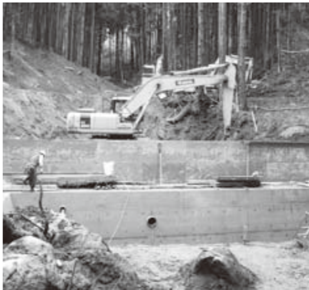
工事が進む神宮寺ヲフロ沢地区の治山ダム

「森林と人の共生林」は、東部海岸沿いの区域で仙台湾海浜県自然環境保全地域に指定されていることから、人が容易に触れ合える森林のため、下刈りや間伐、清掃活動などや無人ヘリコプターによる、薬剤散布、伐倒駆除処理事業を継続して保全管理に努めます。