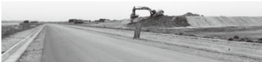
施設整備が待たれる公共ゾーン用地（巨理駅東）