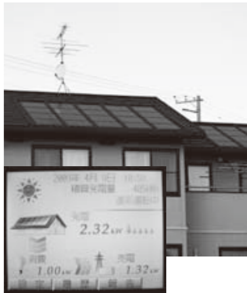
住宅用太陽光発電システム

町長 固定資産税の軽減措置は地方税法により、新築住宅、耐震改修、パリアフリー改修、熱損失防止改修を行った住宅等