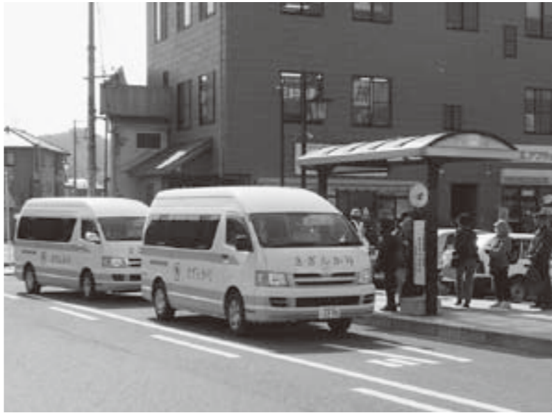
地域の足「さざんか号」

町長 フリー乗降制、路線の見直し、デマンド乗合タクシーの運行などを考えています。