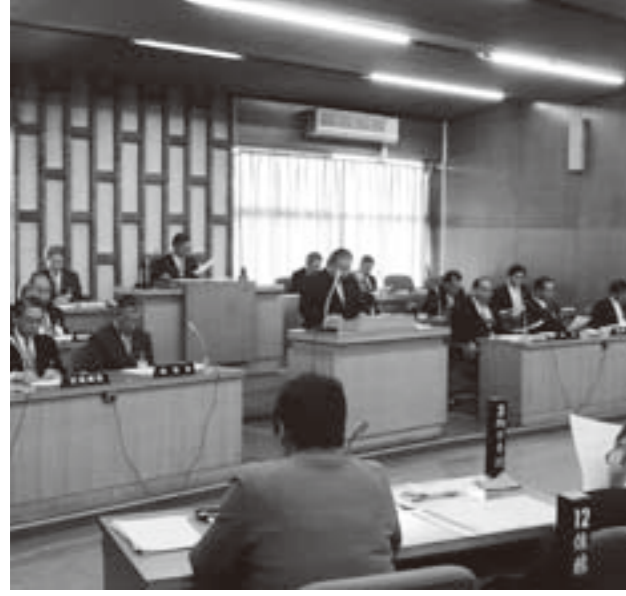
予算審査特別委員長報告