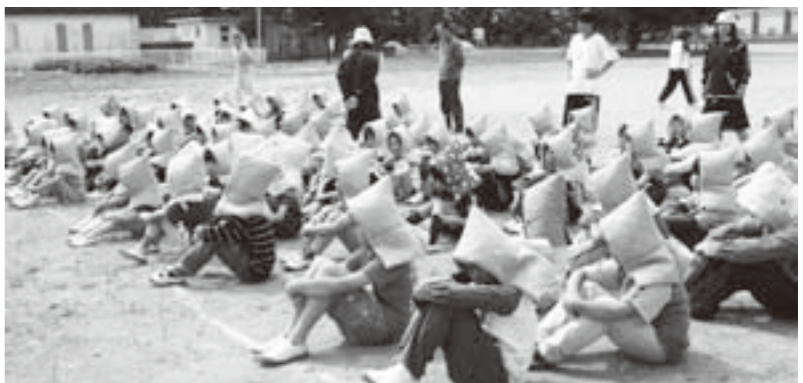
防災ずきんを着用した避難訓練（高屋小学校）

問 30年以内の発生確率99%と言われる宮城県沖地震に向けて、地割れ、津波、ガラスの散乱、蛍光灯の落下、負傷者の数、放送設備、ライフレイン、通信手段等の被害の想定は考えているか。