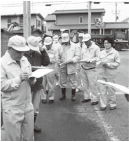
公共下水道事業汚水枝線工事

問 吉田体育館の卓球台を仕切るフェンスが鉄製で高齢者には危険である。軽量であるプラスチック製に取り替えられないか。 生涯学習課長 徐々に計画的に買い換えます。