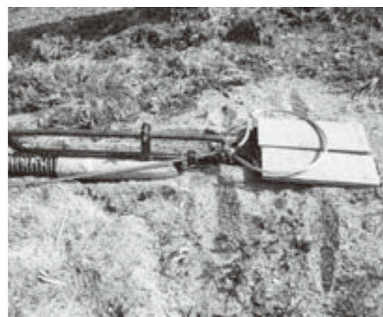
イノシシ捕獲罠の一例（くくり罠）イノシシの通り道に適切なサイズの穴を掘り、その上に先端をリング状にしたワイヤーをセットし、踏み込むことでワイヤーが脚を縛る構造。

町長 被害、苦情件数は20件程度で、西部丘陵地帯の農地のほぼ全域から報告を受けています。被害額は年間約100万円。捕獲頭数は、平成20年度で