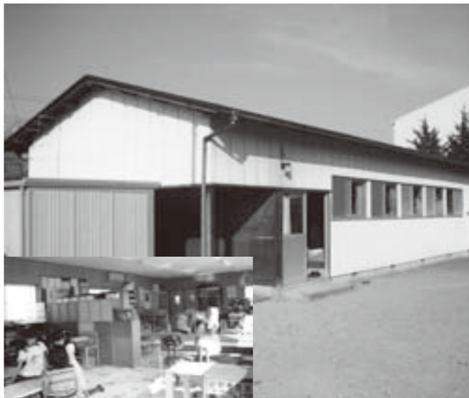
民家を借り入れ放課後の居場所作りを行う 託児指導員緊急雇用事業（児童クラブ逢隈分室）

町長 国の地域活性化・生活対策臨時交付金を活用して町発注予定工事等の前倒し、企業誘致にかかると緊急雇用の創設、通