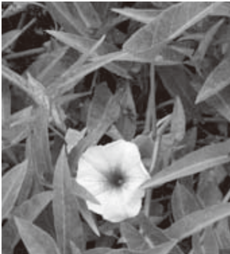
空心菜は、東南アジアで盛んに栽培されている野菜で水辺に生育します。茎の中が空洞になっているため、水をよく吸収することから水質浄化に利用されます。