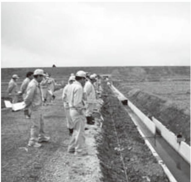
牛袋農業用排水路改修工事