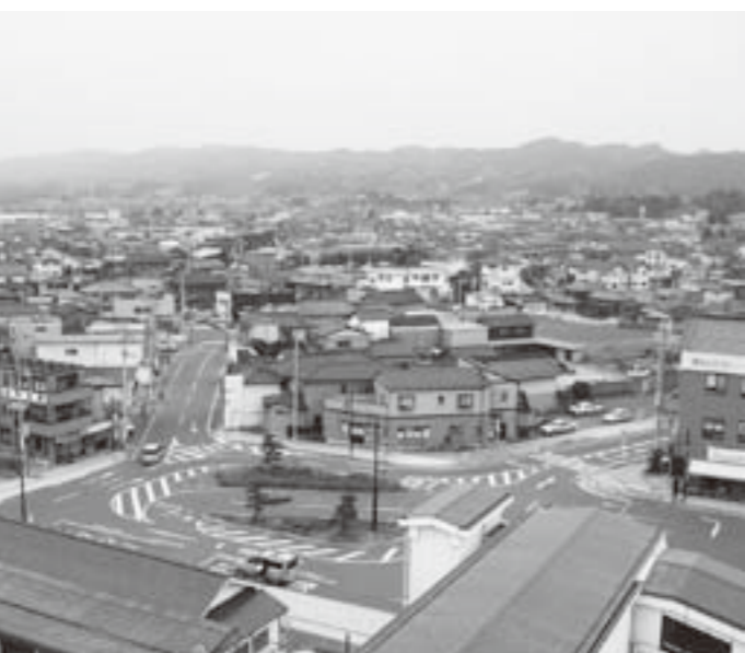
悠里館から見た町の様子

問 巨理・山元町の合併は平成17年3月に時期尚早との判断で見送られた。合併特例新法の期限が来年の3月となったが、山元町との合併についての考えは。 町長 県の構想である二市二町の合併も合わせ、議論を見据えながら今後の町のあるべき姿を模索していきたいと考えています。