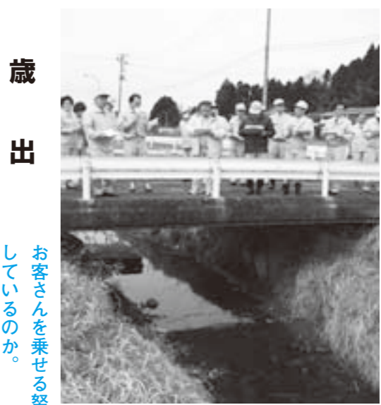
現地調査 田沢農業用排水路改修工事