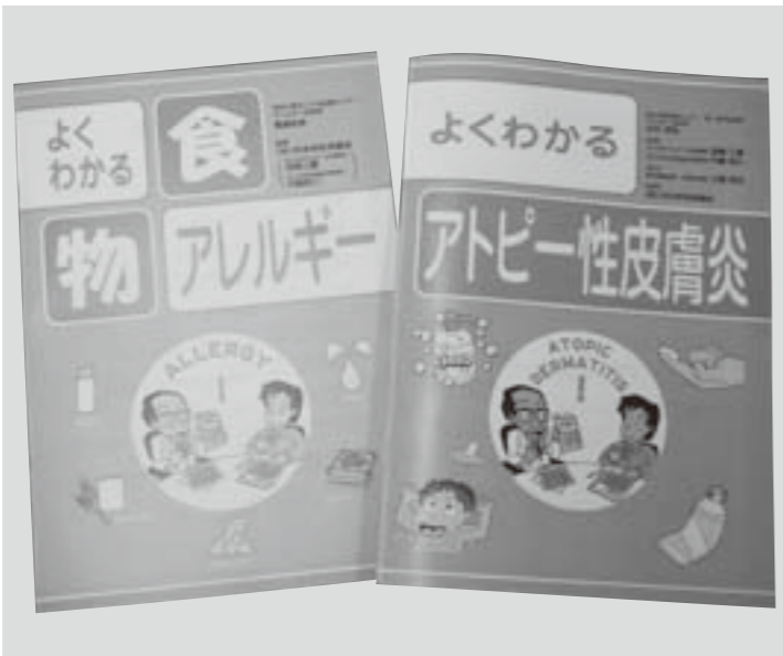
アレルギー疾患の啓発資料

他の子供たちの理解と地域の支えが重要です。わかりやすい啓発資料がありましたので、今後配布しご理解をいただきたいと考えています。