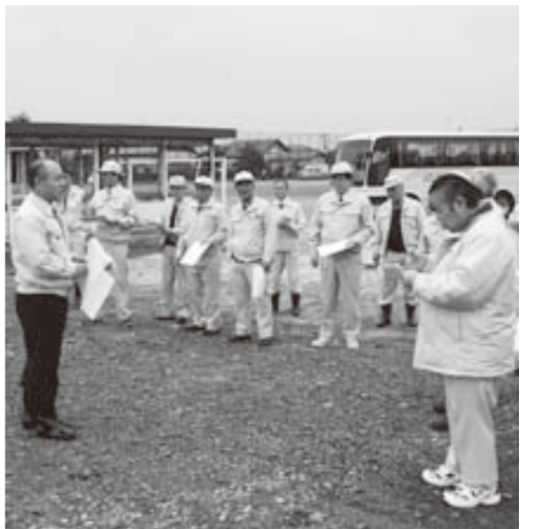
中央児童センター建設予定地

問 特色ある学校づくり推進事業補助金が減額になったが。 学務課長 国の学習指導要綱の改訂により総合的な学習時間が縮減されたためです。