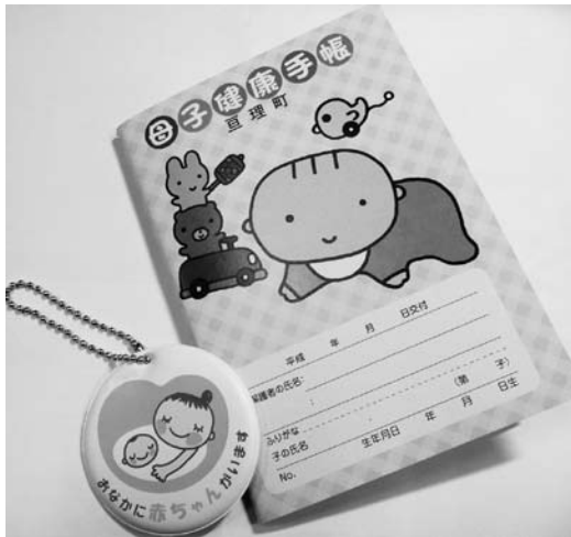
母子健康手帳とマタニティマークキーホルダー

保健福祉課長 4月号の「広報わたり」に1ページにわたって掲載を準備しています。3月までに妊娠届けをされて母子手帳を取得した方には通知を差し上げます。この3月定例会が終わり次第対応していく考えです。