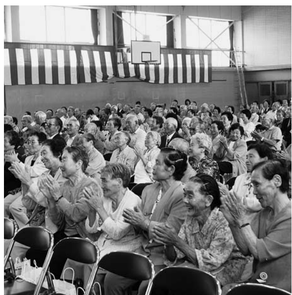
4地区毎に開催されている敬老式典

保健福祉課長 現在のところ予算措置的なことはありませんが、今後山元町と一緒に根強く、亶理郡医師会に働きかけたいきます。