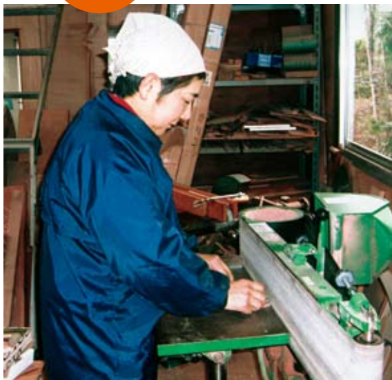
手づくりオルゴールを製作している所。