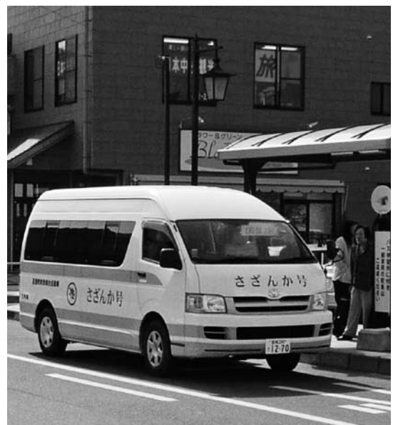
地域の足「さざんか号」

町長 全地域を回ることになれば、今のバスの倍の台数でも足りないと思っております。時間帯や負担の問題。まちづくり基本条例、協働のまちづくり、すなわち町民、議会、町が一体となって、費用対効果等を考えながら進むべきと思っております。これらについては4月の会議にはかり、結果を見守りたいと思っております。