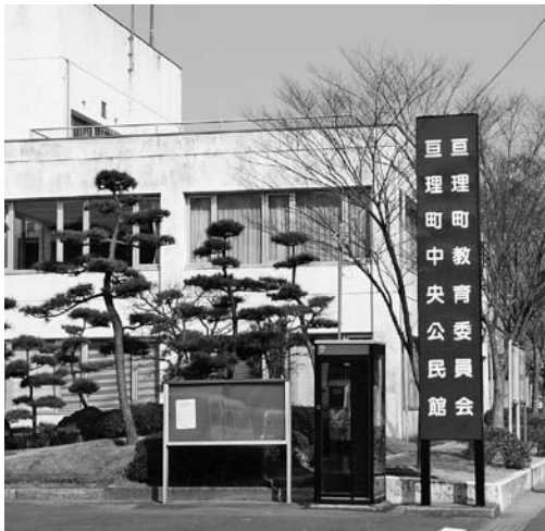
巨理町教育委員会 (中央公民館内)

教育長 相手もあり、予算も伴いますので検討していきたいと思いますが、希望者はいないようです。