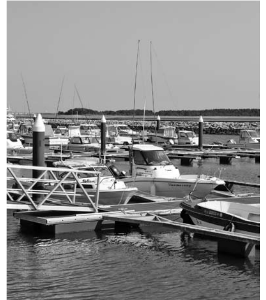
フィッシャリーナ (鳥の海)