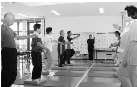
介護予防拠点施設 わたり温泉健康センター