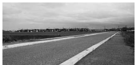
施設整備が待ち望まれる公共ゾーン周辺

町長 保健センターは狭く老朽化し本来の機能が果たせない状況です。平成18年7月に施設整備検討委員会を設置し、現在まで5回建設検討委員会、さらに公聴会を開催。また町のホームページに掲載し、町民から意見を拝聴しています。今後、技術力や経験、事業に臨む体制等を含めた提案書をもとに、もつとも適した設計者を選ぶプロポーザル方式で進めていきます。建設は国からの補助金がなく、財政状況を見極めた上で考えていきます。