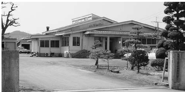
老朽化が進む巨理町学校給食センター

町長 給食センターには診断の義務はありませんが、ボイラー2基を入れ替えており、修繕を伴うものについては十分対応しながら、地震災害に遭わないような方法で十分