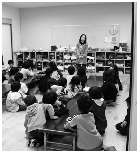
巨理児童クラブ（巨理小学校体育館）

議長が「教育福祉常任委員会に付託し会期中に可否の報告を求めるとの賛否をはかった結果、賛成者多数で可決され、巨理町放課後児童クラブ条例は教育福祉常任委員会に付託されました。