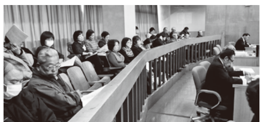
3月定例会 傍聴者のみなさん