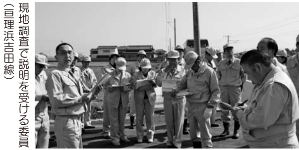
現地調査で説明を受ける委員(回理浜田田線)