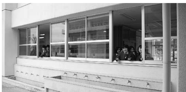
入学式で新生を迎える在校生

教育長 教育委員会、校長会、教頭会等、現場の先生方の意見を聞きながら、その後の状況を見極めながら、やっていくのが大事なのだと思っています。