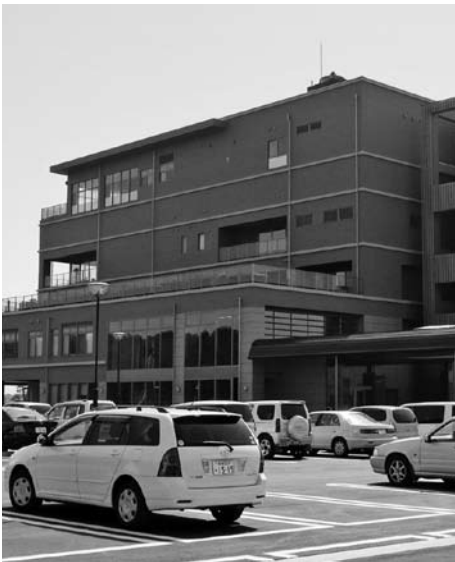
オープンから連日賑わう「わたり温泉鳥の海」

町長 オープン前に発起人の方々が何度か塩釜保健所岩沼支所に伺い、直接指導を受けていると共に、ふれあい市場全組合員を対象に、食品衛生講習会を実施しています。