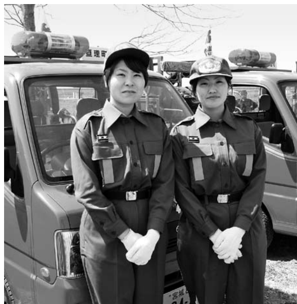
巨理町消防団に初の女性団員(逢隈分団)

問 地方自治体での努力義務・町の責務として、今後の推進計画を伺う。 町長 「協働のまちづく