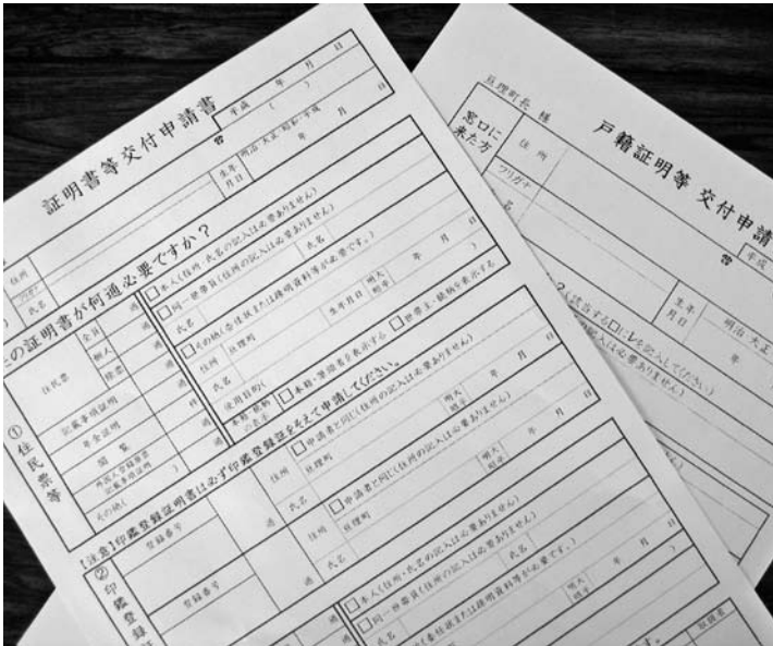
住民票などの各種証明書交付申請書

町長 公文書については、全国的に見ると、性同一性障害の方々への配慮から、性別欄を設けない自治体が出てきている状況にあります。本町におきましても、今後、各公文書について見直しを行い、戸籍法や住民基本台帳等、国・県の法令等に基づくものを除き、性別欄の廃止について検討していきたいと思えます。