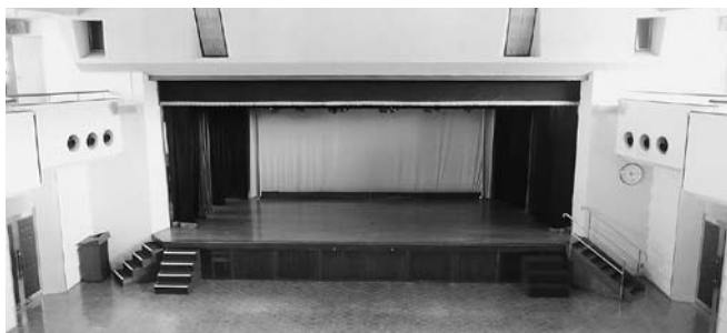
たくさんの方に利用される大ホール(亘理町中央公民館)

町長 今後の本町の広告事業については、有料広告掲載に関する要綱を作り、平成20年度から広報活動を行う準備を現在進めています。「広報わたり」と「封筒」については夏頃から、ホームページ上のバナー広告は10月から実施したいと思えます。